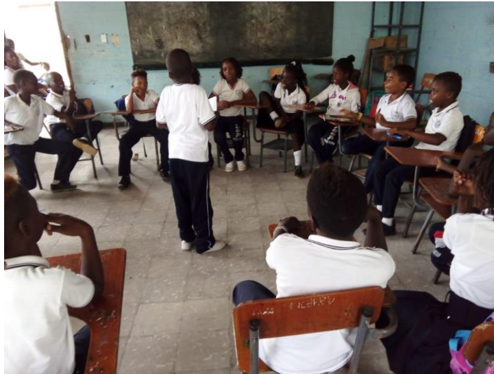
Figura 3. Socialización de la actividad

De la misma manera también se desarrolló otra activada sobre el derechos de los niños y las niñas; en primer lugar se trabajó el concepto a través de la técnica de lluvias de ideas, se les preguntó a los niños sí que entendían por derechos de los niño, en donde cada uno fue respondiendo según sus conocimientos el concepto y los docentes tomaron apuntes en el tablero de las respuestas en donde muchos de ellos manifestaron que los derechos eran unos reglamentos para proteger a los niños otros por su parte expusieron que eran unas leyes, mientras que para otros los relacionaron con un conjuntos de cosas para el desarrollo de los niños, sin embargo otros saben que tienen unos derechos y se les dificulta definirlos fue así como. De esta manera se conceptualizó los derechos de los niños posteriormente los docentes de practica dieron a conocer puntualmente los tipos de derechos a través de videos y se retroalimentó esta actividad con fichas en donde se podían identificar los derechos de los niños, los estudiante observan detalladamente y luego señalaban en la gráfica el derecho que evidenciaban.