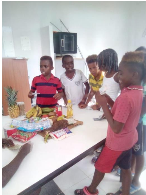
Figura 4. Actividad canasta familiar.

Finalmente se aborda el tema el mercado para dar el cumplimiento así al tercer logro en donde los docentes les pidieron llevar al estudiante un producto para explicarle como en la vida cotidiana se refleja el proceso de compra y ventas de productos y además se simuló el desarrollo de la oferta y demanda mediante un simulacro en donde se dio a conocer los mecanismos de oferta y demandas mientras unos estudiantes hacen el proceso de venta otros simulaban comprar el producto.