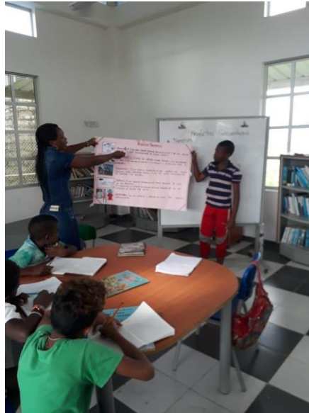
Figura 1. Presentación de carteleras

campaña decidieron realizar la revocatoria al mandato.