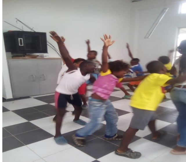
Figura 2. Dinámica el ritmo.