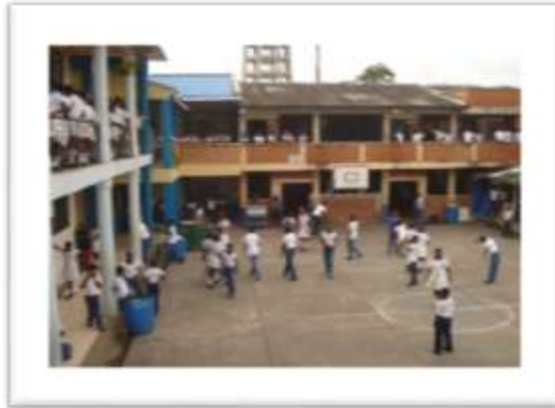
Figura 2: Sede IE Fátima