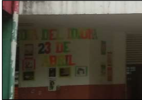
Figura 4: Entornos de aprendizaje

La implementación de esta propuesta pedagógica fue enfocada en la oralidad, teniendo en cuenta que cada una de las actividades realizadas por el grupo investigador da cuenta de la importancia de reconocernos como grupo étnico que hace parte de una cultura afro y que tiene sus cimientos en la oralidad como manera de transmitir sus conocimientos de generación en generación. Es así como se desarrollaron 4 planes de aula con sus diferentes actividades buscando de esta manera mitigar poco a poco el problema de lectoescritura que tienen los estudiantes del grado quinto uno, de primaria de la institución educativa nuestra señora de Fátima.