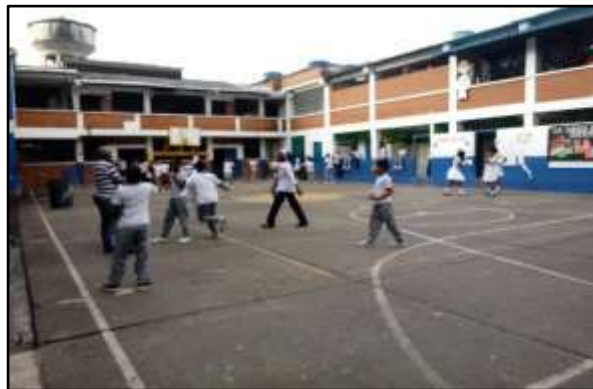
Imagen 6: Tiempo libre en el patio de la institución