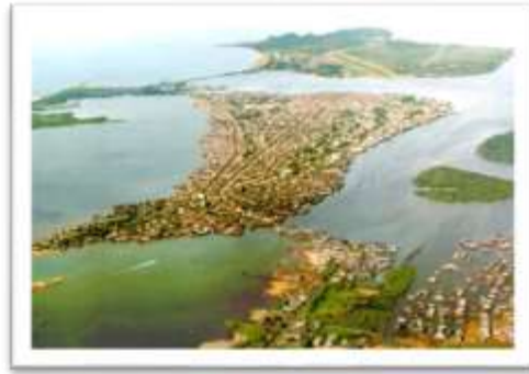
Figura 1: Mapa municipio de Tumaco

“Los primeros pobladores de éstas, fueron unos indígenas trashumantes que cultivan el maíz y la yuca. Además, eran pescadores y cazaban pequeños animales. Construyeron casas de madera con techos de hoja de palma; eran expertos alfareros y orfebres incomparables. Adoraban como dioses al jaguar y a la anaconda. Desaparecieron misteriosamente de estas tierras después de un milenio de permanencia, pero los museos del mundo aún conservan muchas figuras y utensilios de oro y arcilla elaborados por aquellos inimitables” (Chávez Chamorro, 1983 Pág. 167.)