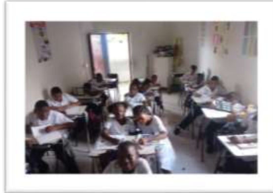
Figura 3: Curso Quinto 1

déficit social; o la postura agresiva podría tener otras connotaciones negativas derivadas del retraimiento.