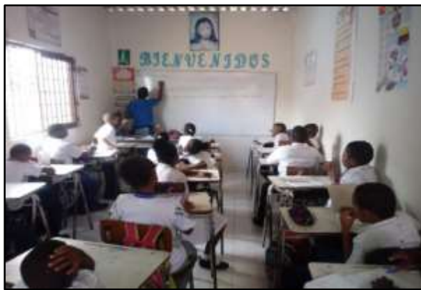
Imagen 5: En clases con los estudiantes grado quinto

crear nuevas estrategias pedagógicas para saber llegar a ellos de mejor manera y que ellos también asimilen los conocimientos que deseamos impartirles dentro del salón de clases. El contexto es el adecuado para desarrollar actividades enfocadas encaminadas en el rescate o cultivo de nuestra cultura, pero los estudiantes no acogen de la mejor manera la propuesta debido a que prefieren los aparatos tecnológicos y aprender a tocar los instrumentos musicales tradicionales de nuestra cultura.