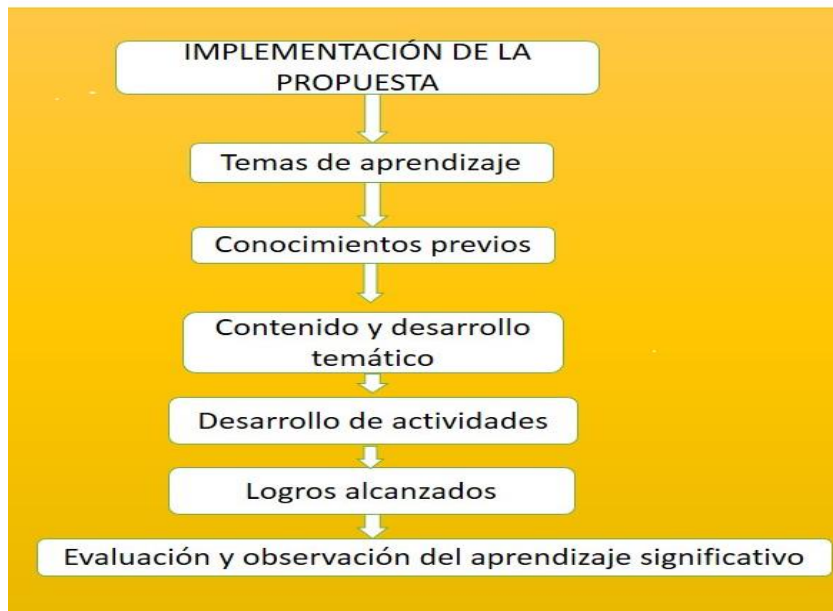
Figura 2. Implementación pedagógica