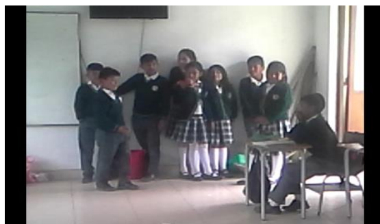
Figura 3. Estudiantes intercambiando productos

Luego de cada salida de campo y la realización de una determinada actividad se procedió a realizar una meza redonda con el fin de establecer los beneficios de nuestro usos y costumbres donde fue necesario que el modelo pedagógico desarrollista sea también vinculado con el modelo pedagógico tradicional ya que fue necesario realizar una explicación detallada de los beneficios como tal de cada actividad ya que cuando se enfatizó el tema de beneficios de los usos costumbres y tradiciones hubo muchas falencias ya que los estudiantes no participaban en la mesa redonda desconociendo a pesar de haber llevado a la práctica cada actividad teniendo en cuenta que los beneficios forman parte del desarrollo de la propuesta investigativa. En la cual se les explicaba que estos conocimientos se sigan perviviendo a lo largo del tiempo y a través del compartir de la palabra Con todo esto se logró que los estudiantes del grado cuarto y quinto comprendan el valor del trueque.