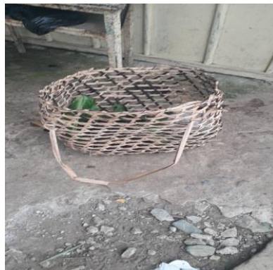
Figura 4. Imagen el canasto

Se observó la motivación e interés donde mencionaron que cuando se iban a repetir la clase porque con el tejido del canasto entendieron más a fondo la explicación de cómo valorar los conocimientos a través de entretejer como forma de enseñar y aprender, Pero si hubo algunas falencias o desventajas porque dos estudiantes no eran del resguardo y mostraron desinterés y llevando así el mismo desinterés a los demás. Estos estudiantes mencionaron que ellos jamás utilizarían el canasto porque ellos vienen de otro lugar muy distinto a nuestro Resguardo.