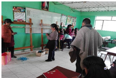
Figura 1. El Tejido Ancestral

que las nuevas generaciones dejen de lado las costumbres propias y vayan desapareciendo con el pasar del tiempo, ya que ellas en la actualidad se están dando cuenta que los niños y jóvenes están siendo influenciados fuertemente por otras culturas foráneas, por un mundo globalizado y globalizante mediante el aumento masivo y la mala utilización de la tecnología.