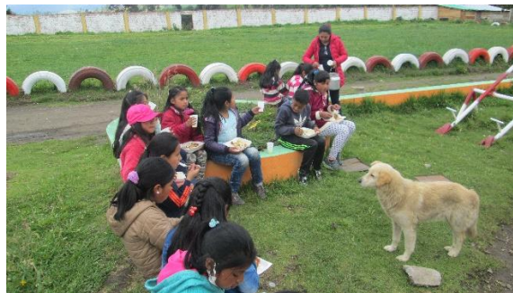
Figura 7. El Compartir

Durante el desarrollo de cada actividad se hizo el ejercicio del compartir, la olla común, recordando las costumbres de nuestros mayores