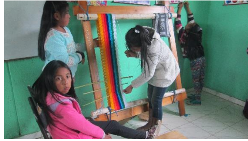
Figura 4. La Urdimbre

Siguiendo con el proceso del quinchilado los estudiantes desarrollaron la motricidad fina, la memoria, la coordinación es con el fin de hacer el entrecruzado de cada hebra del parado para dejar listo para continuar con el entramado.