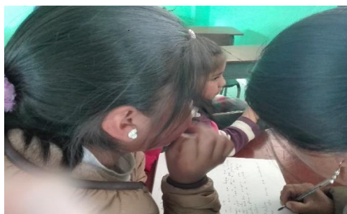
Figura 2. Los Estudiantes comentan

Los niños del grado quinto expresaron que se sentían motivados a recuperar y reconstruir los saberes ancestrales especialmente el tejido, por eso manifestaron su deseo de participar en este presente proyecto para no dejar desaparecer el legado de nuestros mayores.