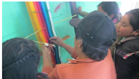
Figura 5. El Quinchilado

Siguiendo con el proceso del quinchilado los estudiantes desarrollaron la motricidad fina, la memoria, la coordinación es con el fin de hacer el entrecruzado de cada hebra del parado para dejar listo para continuar con el entramado.