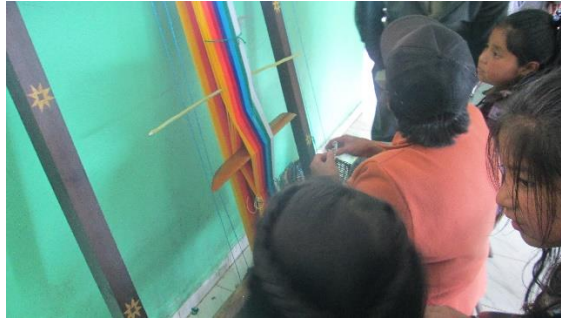
Figura 6. El Entramado

Durante el desarrollo de cada actividad se hizo el ejercicio del compartir, la olla común, recordando las costumbres de nuestros mayores