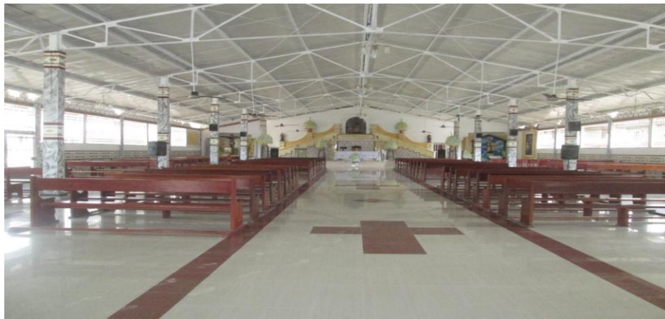
Figura 15. Iglesia de “JESUS NAZARENO”

La mayoría de los habitantes de Payán profesan la religión católica en un 80%, y en un mínimo porcentaje otras religiones como la pentecostal unida de Colombia y la iglesia cruzada cristiana entre otras. En el pueblo la fiesta religiosa más importante es la patronales en honor al Padre Jesús Nazareno, que se celebra el día seis (6) de enero de cada año.