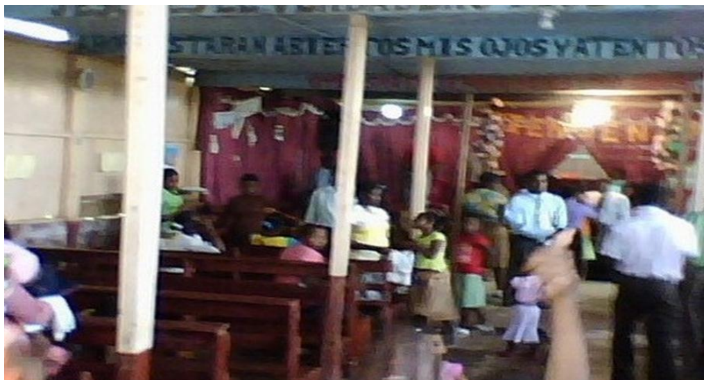
Figura 16. Iglesia de la religión Pentecostal.

Actualmente la parroquia cuenta con un sacerdote y un seminarista de manera permanente. Además, en el municipio existen otras corrientes religiosas como La Nueva Alianza, Testigos de Jehová, Iglesia Pentecostés, Iglesia Cristiana y han influido en la comunidad hasta el punto que personas que eran católicas, hoy pertenecen a dichas religiones.