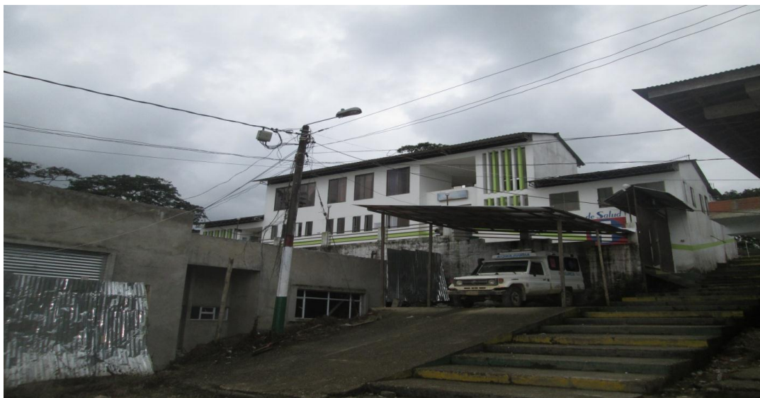
Figura 9. ESE Saúl Quiñones