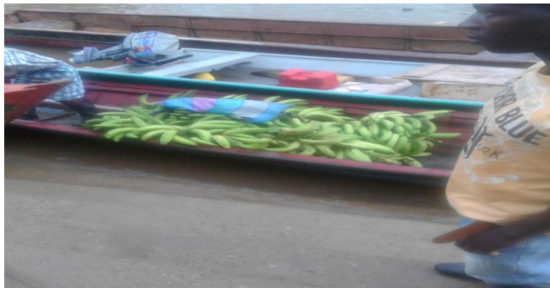
Figura 19. Comercialización de plátano a orillas del río Magüi

Luego por la arremetida del gobierno en acabar con los cultivos ilícitos, la gente volvió a la siembra de los cultivos tradicionales como el plátano y el arroz, que son considerados como cultivos de subsistencia, sobre todo a aquellas familias que por diferentes circunstancias no pudieron entrar en el negocio de la coca, quienes se han dedicado a la extracción del oro, para la extracción de este precioso metal lo hacían en forma rudimentaria, utilizando bateas, barras, artesas, cachos, palas, almocafres, quienes en el afán de conseguir un granito de oro para el sustento diario de ellos y de su familia arriesgando sus vidas en tierras de alto riesgo que están sedimentadas ya que en esta zona trabajan retroexcavadoras que van dejando enormes charcas que son criaderos de zancudos e otros insectos que son perjudiciales para la salud de las personas, otros ya en pequeñas sociedades o individualmente consiguen dragas o motobombas para trabajar.