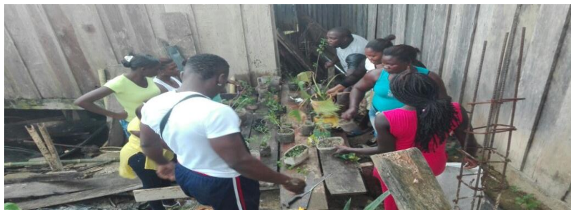
Figura 21. Siembra de plantas medicinales.