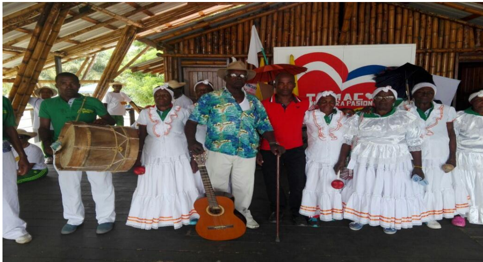
Figura 6. Adultos mayores de Magui Payan

En Magüi Payán El 97% de la población es afro descendiente y el 3% restante pertenece a otras etnias, de acuerdo a la población proyectada por el DANE para el 2015 son en total 22.437 habitantes, el 3% serian aproximadamente 670 personas de otras etnias, especialmente de las comunidades indígenas: Awá, Esperara Siapidara e Inga, los cuales se encuentran asentados en los límites con los Municipios de Cumbitara y Policarpa.