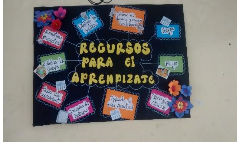
Figura 23. Recursos para el aprendizaje propio