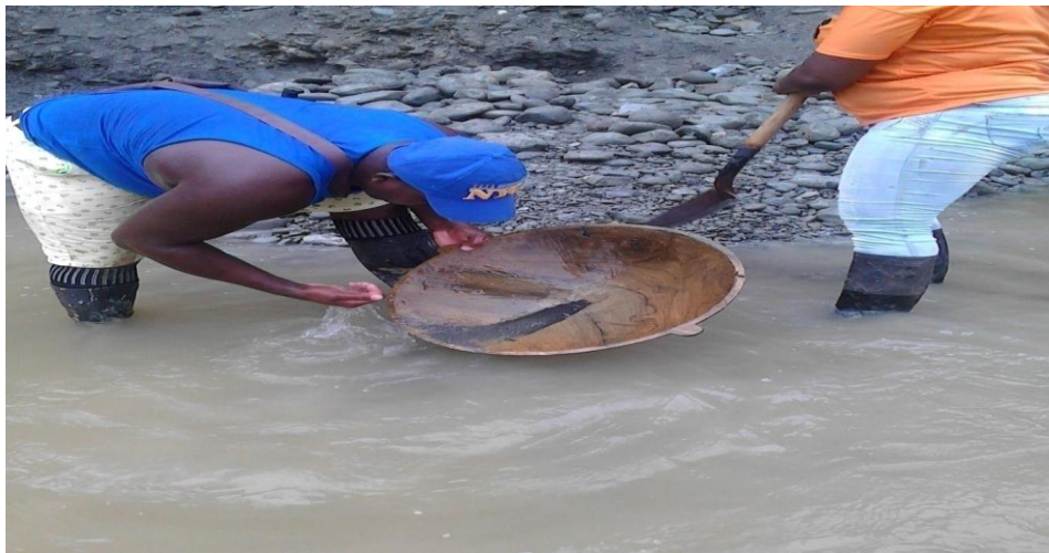
Figura 18. Barequeando rebuscando el jornal diario

El municipio de Magüi Payán, basa su economía en la agricultura y la minería, dada sus condiciones agroecológicas favorables para el desarrollo de estas actividades, sin embargo, sus bajos niveles tecnológicos hacen que no sean aprovechadas racionalmente por los nativos.