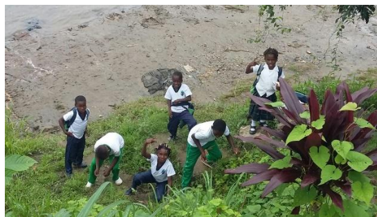
Figura 22. Estudiantes en la huerta pedagógica