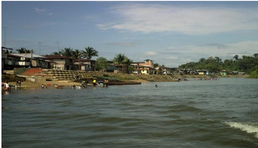
Figura 4. Río Magüi en su estado natural

Magüi payan está inmerso en la vertiente y cuenca del río Patía, que pasa dentro de la extensión municipal, tocando el 73.2% del territorio; el río Magüi es uno de sus tributarios. En la región hay diferentes ríos que la caracterizan y que influyen en las tierras que bañan y en la forma como los utilizan sus habitantes, sus costumbres y prácticas tradicionales de producción, los ríos son el eje de la vida, entre los que se destacan los ríos Patía grande o nuevo, Patía viejo, Guañambí, estero Seco, Nansalví y el que baña la cabecera municipal