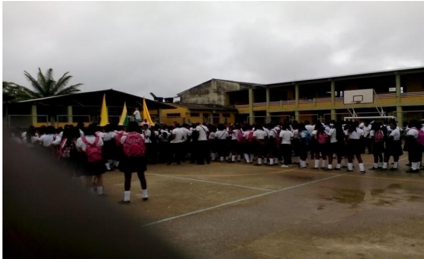
Figura 8. Estudiante de la institución Educativa Eliseo Payan sede ciudadela

Mediante circulares N0 037 y 041 de agosto 19 y 16 de septiembre de 2002 respectivamente, la secretaria de Educación del departamento de Nariño, definió los conceptos de fusión y asociación de establecimientos educativos y definió los criterios y procedimiento para la conformación de instituciones educativas.