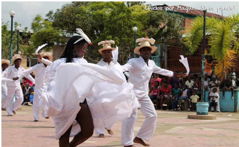
Figura 11. Baile de currulao

El currulao: Conserva el origen africano, expresión más representativa de la cultura negra del pacífico. Tiene su origen en los negros, quienes inicialmente poblaron el valle del Patía y los campos auríferos de Magüi, extendiéndose a la rivera de los ríos y costas, existen otros bailes menos notorios como la danza del pilde, el patacoré, la contradanza de los monos, los negritos, etc.