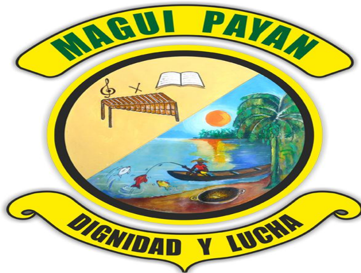
Figura 14. Escudo de Magüi Payán