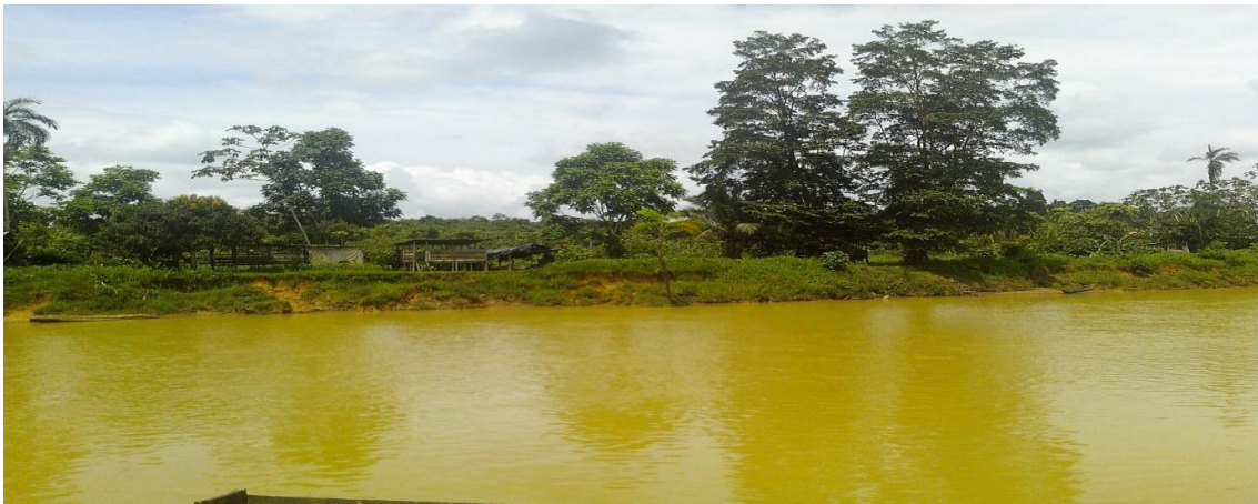
Figura 5. Río Magüi turbio por efectos de la minería

El río Magüi que en otrora de nuestros mayores constantemente permanecían sus aguas cristalinas dignas de envidiar, pero en estos momentos da lástima ver el estado de las aguas de nuestro río ya que en un 80% de los días del año permanece turbio como consecuencia de trabajos mineros especialmente con retroexcavadoras, dragones y motobombas sin que ninguna autoridad se apersone y se condele con la comunidad Magüireña y de esta manera no llevar a la contaminación total de esta fuente hídrica que todavía puede llegar a salvarse con el compromiso y voluntad de todos.