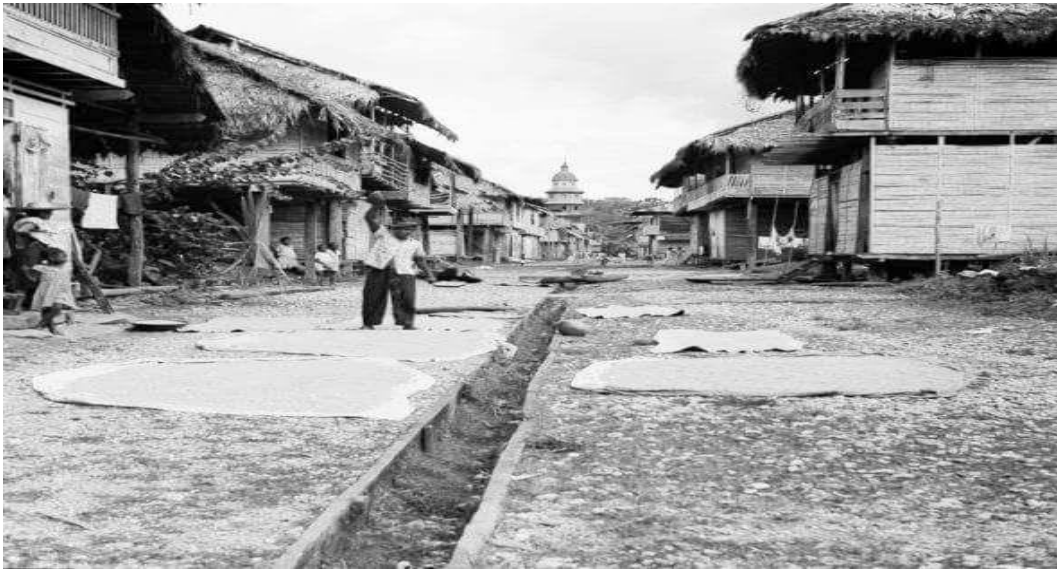
Figura 1. Así era Payán hace mas de 50 años

La localización de la cabecera del municipio se hizo históricamente, como muchos asentamientos de población negra al margen de uno de los ríos tributarios del Patía. El río mayor, el Patía, pertenece a la Región Hidrográfica Occidental de Nariño y por sus dimensiones ocupa en segundo lugar entre los del litoral Pacífico. El río Magüi del cual se deriva el nombre del municipio es tributario del Patía, perteneciente a la cuenca “Medio Patía”, con 156.000 has. Esta característica territorial y cultural le imprime a la región un comportamiento especial debido a que la vida deriva en un índice altísimo, del comportamiento de la red fluvial que atraviesa la vertiente pacífica. El área de la subcuenta del río Magüi es de 34.170 has, 19% del municipio.