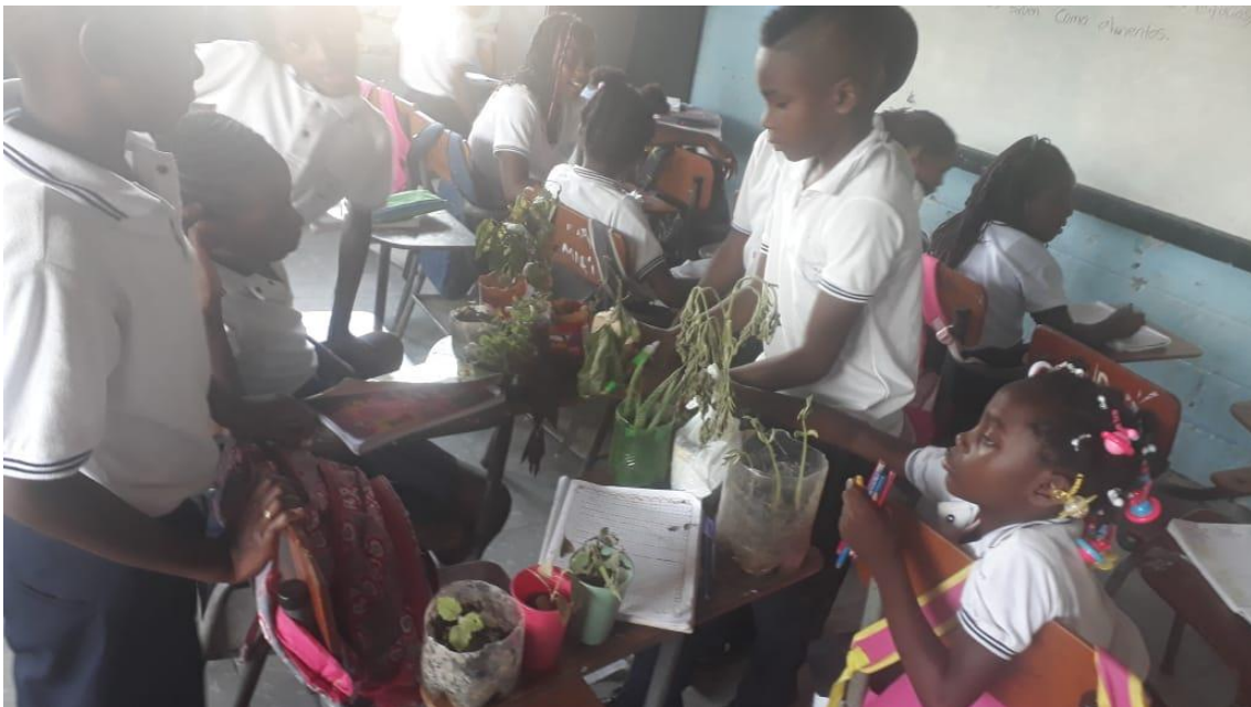
Figura 24. Recursos herbarios