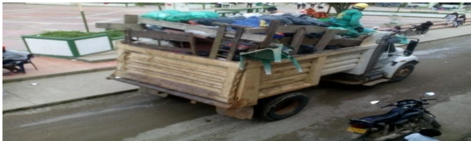
Figura 17. Recolección de basura en su jornada habitual.

El servicio de aseo que incluye la recolección, transporte y disposición de basuras cubre al 90% de las viviendas del municipio. El sitio conocido como San Juan, donde se disponen los residuos, es un botadero a cielo abierto que no tiene manejo higiénico, lo que genera malos olores y contaminación e incrementa el riesgo de enfermedades. La recolección de residuos se hace los lunes, miércoles y viernes en unos horarios de mañana y tarde. El carro recolector no puede acceder a las viviendas que se encuentran en zonas de calle puente. Debido a esto, las familias ubicadas allí suelen arrojar sus basuras y desechos bajo sus casas o al río. Esto genera contaminación del río Magüi y se incrementa el riesgo de enfermedades respiratorias y en la piel, afectando la calidad de vida las personas e incrementado los gastos en salud. Actualmente los servicios los presta una empresa adscrita al municipio. Los usuarios no pagan por los servicios de agua, alcantarillado y aseo. Tampoco existe una veeduría ciudadana que haga control o vigilancia a la gestión y prestación de los servicios.