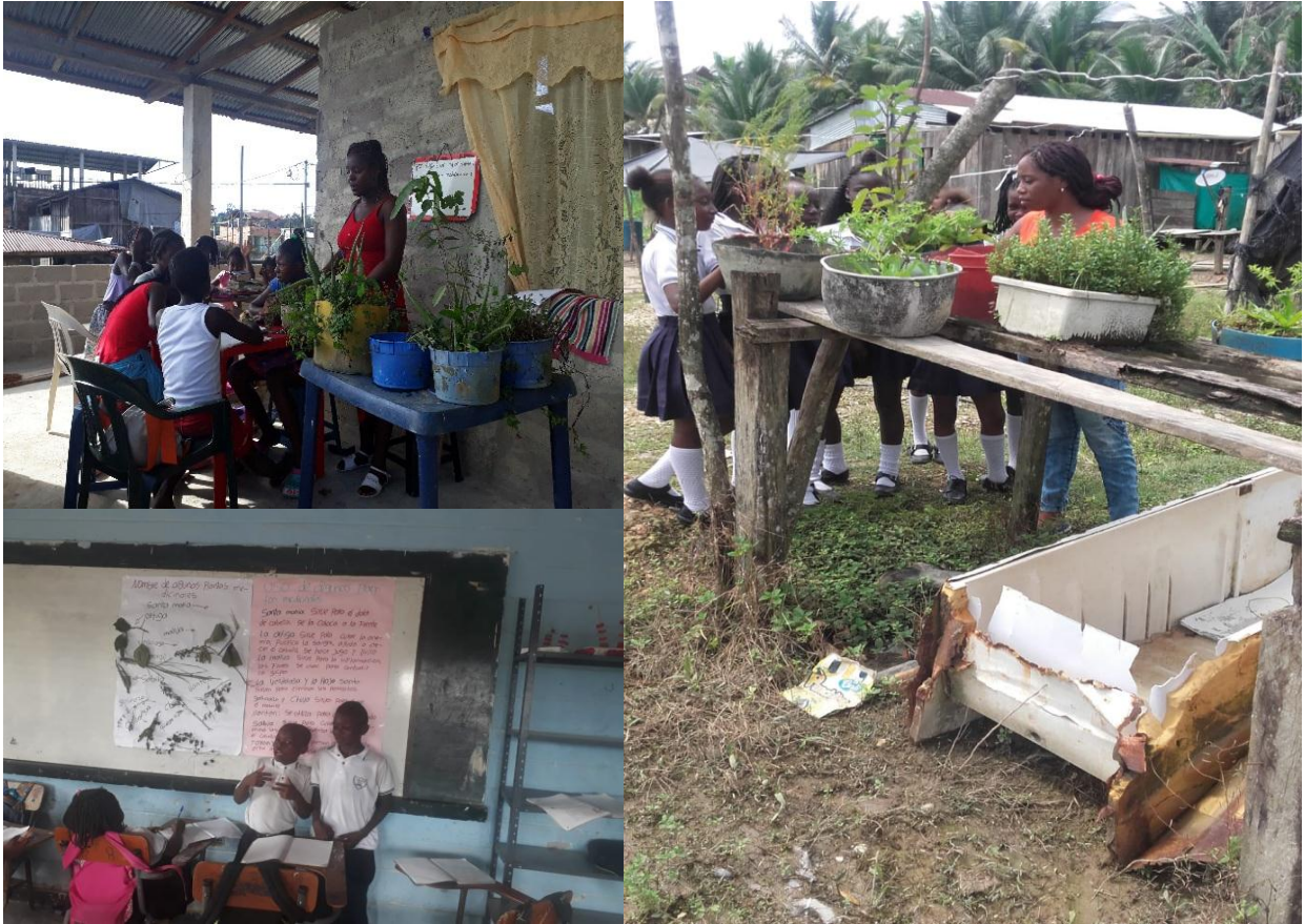
Figura 25. Implementos de la propuesta