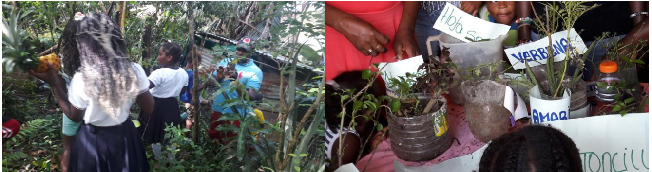
Figura 20. Muestra de plantas medicinales.