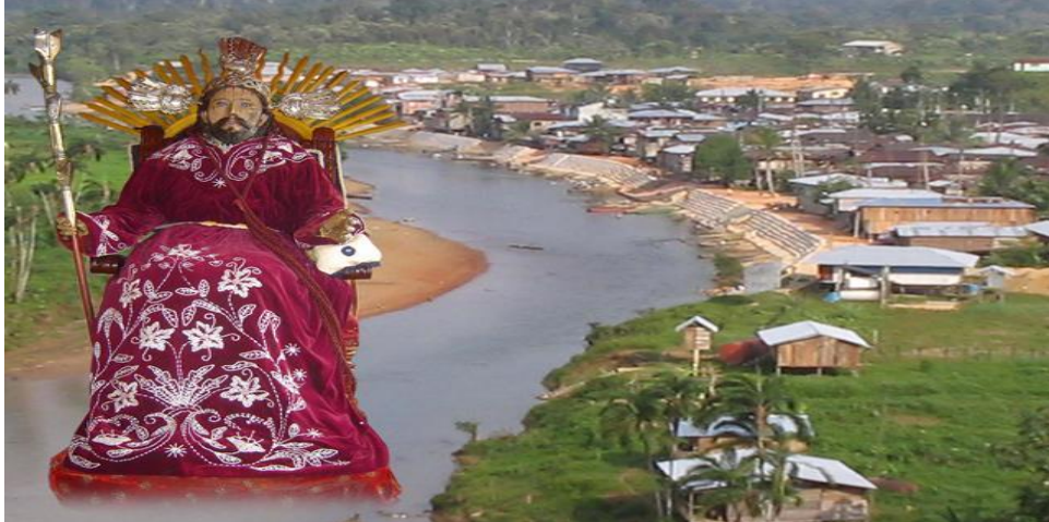
Figura 2. Panorámica aérea actual de la cabecera urbana del municipio.