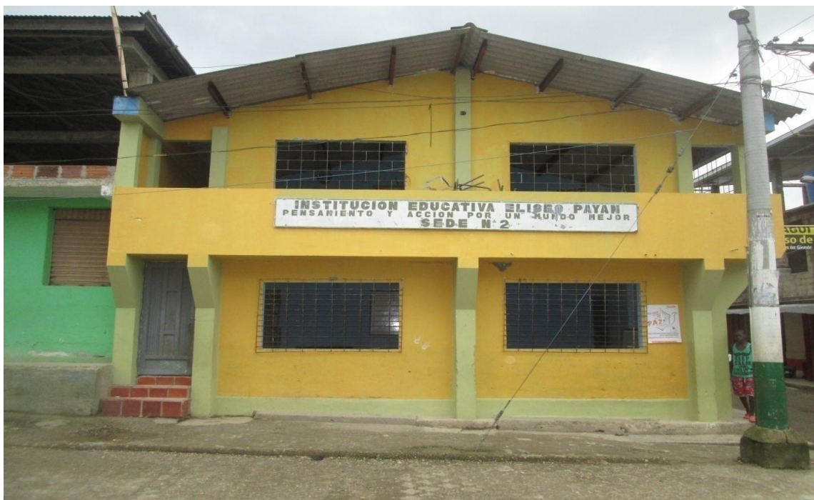
Figura 7. Sede N° 2 Institución Educativa Eliseo Payan sede ciudadela