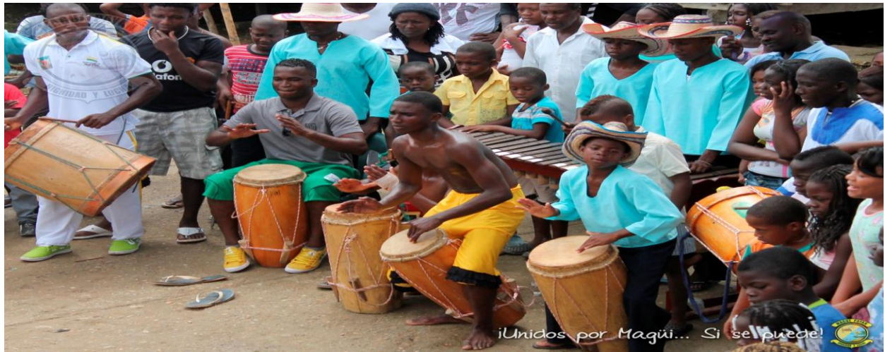
Figura 12. Guasa

Bombo: formado por una caja de resonancia de madera hueca, con tapa en cuero de venado macho y hembra templado por otro de madera y sogas de cuero entre los extremos y dos mazos de balsa para tocar.