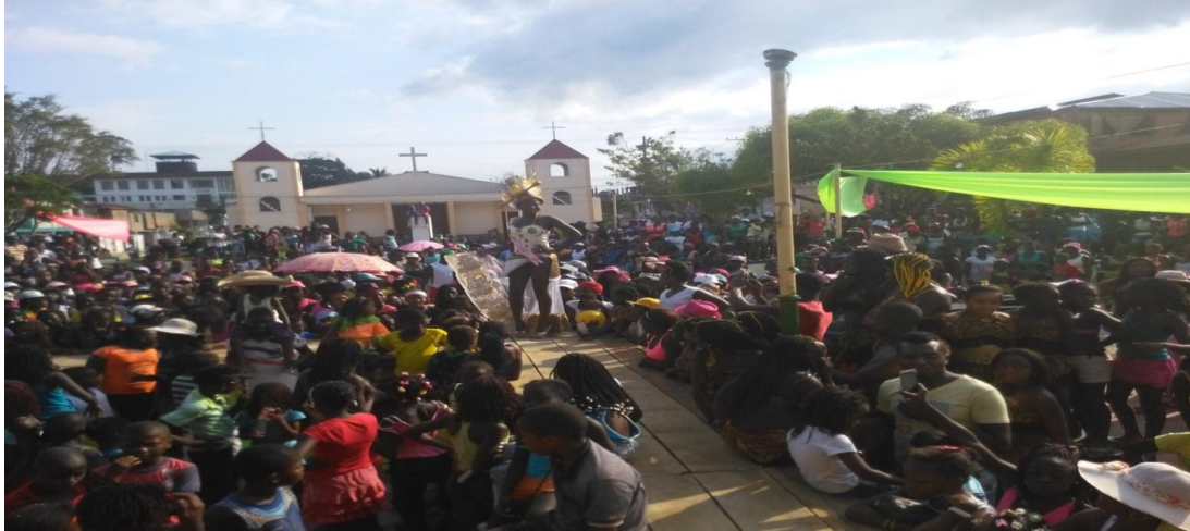
Figura 10. Reinado carnavales del fuego 2016