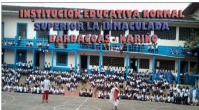
Figura 2. Institución Educativa La Inmaculada