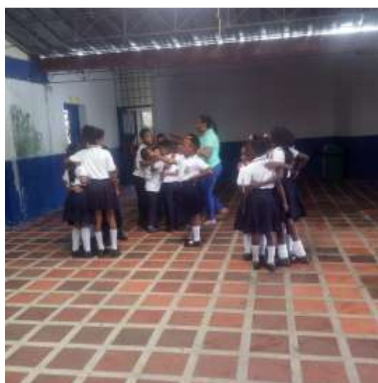
Unión de versos para conformar el arrullo