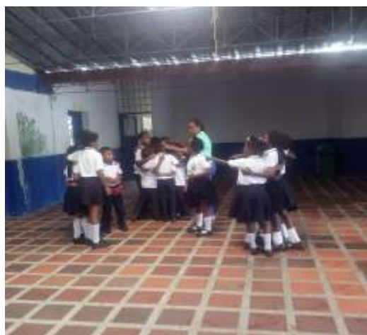
Figura 7. Conformación de grupos

Después de narrar los versos les enseñamos que un verso está formado por una estrofa y que se compone de cuatro renglones y la unión de estos versos forma el arrullo dando como resultado pedagógico alcanzado la interpretación de los versos narrados y de las imágenes presentadas por partes de los estudiantes.