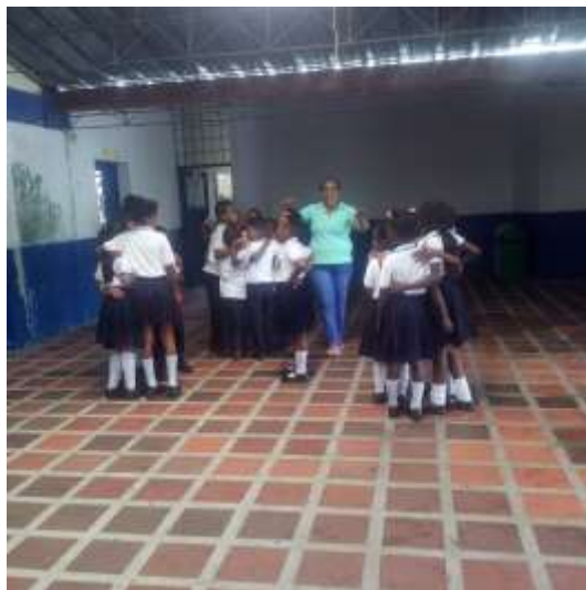
Grupos narración versos