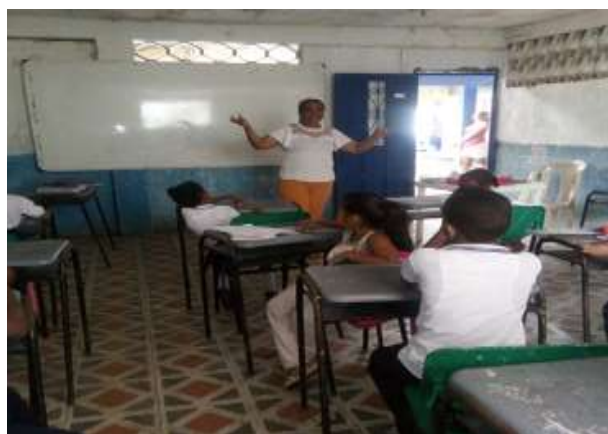
Figura 3. Clases en la Institución Educativa la Inmaculada

La Escuela Normal proyecta sus actividades lúdico-pedagógicas hacia la comunidad en general fortaleciendo todos los componentes del ámbito contextual.