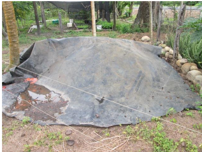
Imagen N° 10. Manejo materia fecal

6.4.1. Manejo de residuos sólidos. Los residuos de las porquerizas, son recolectados y utilizados para hacer abono, reciclándolos, revolviéndolos con gallinaza, materia fecal de semovientes vacunos y cal viva, con un proceso de 45 días para su uso.