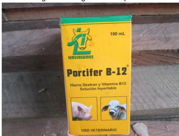
Imagen 14. Programa de suplementación