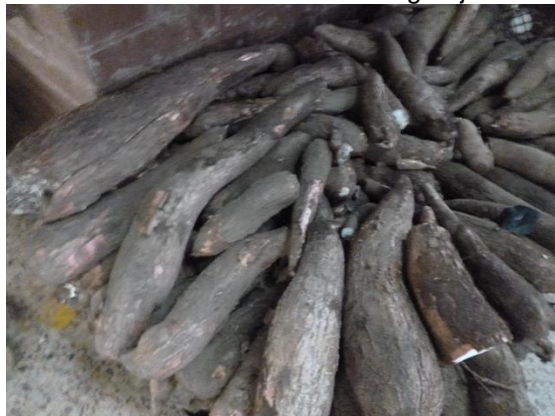
Imagen N° 19 Yuca Manihot esculenta granja los Laureles