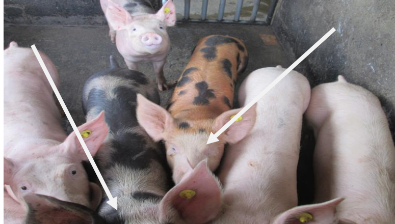
Imagen N° 2. Raza Pietrain