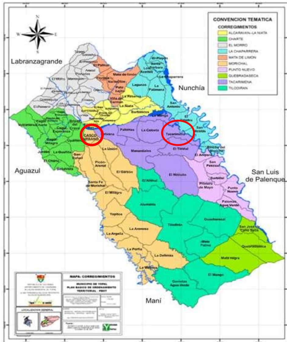
Imagen 5. Mapa División política Rural municipio Yopal

www.yopal-casanare.gov.co/mapas_municipio.shtml