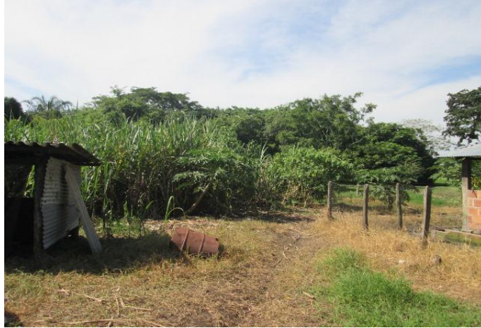
Imagen N° 8. Cultivos de la granja Los Laureles