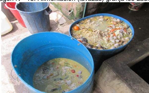
Imagen N° 15. Alimentación (lavazas) granja los Laureles

La tabla N° 6, muestra la cantidad de alimento diario proporcionado a 25 cerdos en la etapa de ceba y el horario en el cual se les provee en la granja los Laureles.