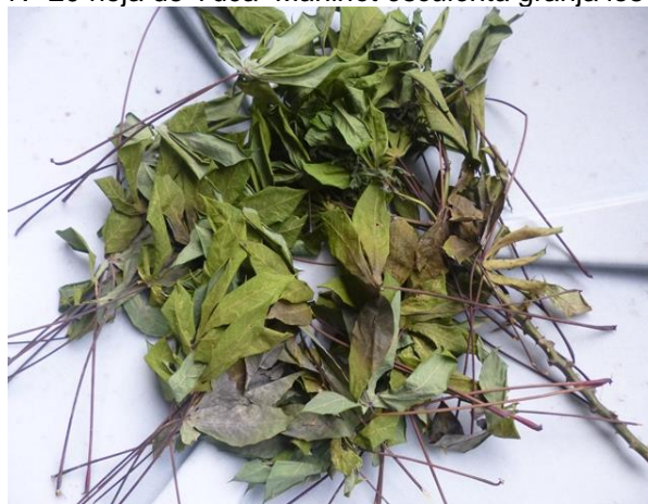
Imagen N° 20 hoja de Yuca Manihot esculenta granja los Laureles

Para ello se propone implementar el cultivo de media hectárea de yuca Manihot esculenta , dentro del predio de la granja Los laureles. El cultivo será dispuesto en cuatro siembras durante el año, para ello se dividirá la media hectárea en cuatro partes o sea en 1/8 de hectárea.