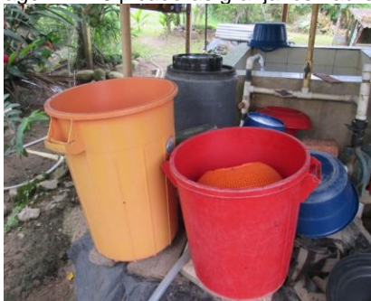
Imagen N° 18 picadoras granja los Laureles

En la tabla N° 14, se indican los equipos y maquinaria utilizados para la recolección de los alimentos de los cerdos y otros equipos para la realización de las diferentes actividades que se llevan a cabo diariamente en la granja los Laureles.