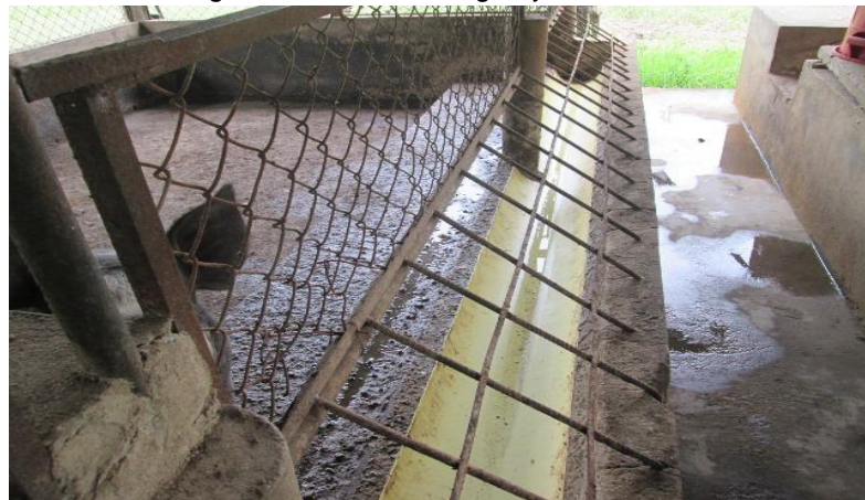
Imagen 12. Comederos granja los Laureles

6.4.3 Manejo de basuras. Las basuras y sobrantes, se recolectan para ser retirados por el vehículo recolector de basuras para su disposición final, aclarando que las basuras producidas son pocas, simplemente bolsas plásticas y residuos de comida de los cerdos.