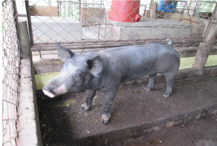
Imagen N° 4. Raza Duroc

La comercialización de la raza Duroc se utiliza fundamentalmente para la obtención de productos curados (curtidos), jamón, paleta, lomo, tanto ha sido su éxito en los últimos años que es la única raza utilizada masivamente para la producción de jamón ibérico como de jamón serrano. 12