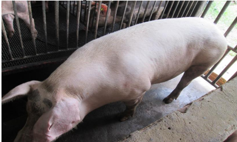
Imagen N° 3. Raza Ladrance