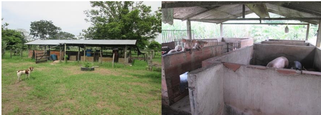
Imagen N° 7. Porqueriza granja los Laureles

con tres jaulas parideras, las cuales tienen una capacidad para una cerda por jaula; dos jaulas para destete con una capacidad para veinte cerdos cada una; también existen tres jaulas de levante con capacidad para quince cerdos cada uno; se cuenta con dos jaulas destinada para cerdos en etapa de ceba los con capacidad para veintidós cerdos; y con cuatro jaulas para cerdas gestantes, con sus respectivos comederos y bebederos (ver imagen 7). En la granja existe también una habitación compuesta por dos habitaciones, una sala, cocina, lavadero con su respectivo tanque, suficiente patio y un kiosco.