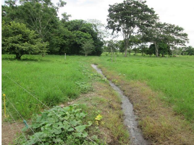
Imagen N° 11. Manejo aguas servidas

6.4.2. Manejo de residuos líquidos. Los líquidos van con destino a un pozo séptico y es utilizado para riego de potreros y pastos de forraje.