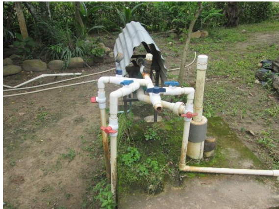
Imagen N° 9. Sistema bombeo agua pozo profundo

Agua: la granja lo Laureles cuenta con un aljibe y un pozo profundo para el suministro de agua, utilizando electrobombas para el bombeo al tanque elevado y tanques no elevados, luego se distribuyen por tubería a diferentes lugares de la granja y a los cerdos se le suministra también por tubería, sistema de bebedero o chupo.