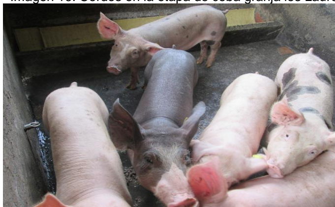
Imagen 16. Cerdos en la etapa de ceba granja los Laureles