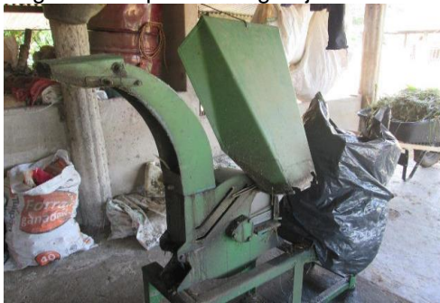
Imagen N° 17 picadoras granja los Laureles

En la granja los laureles existen maquinaria agrícola tales como dos picadoras de pasto con varios servicios, una guadañadora, una hidrolavadora, motosierra.