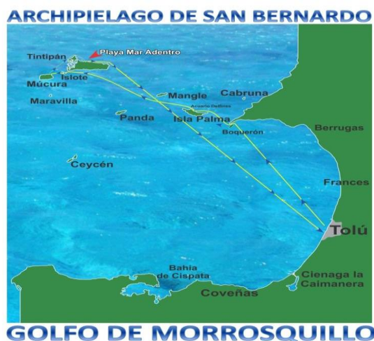
Imagen 1. Mapa Golfo de Morrosquillo

La Villa Santiago de Tolú es uno de los centros urbanos más antiguos de Colombia, el Municipio de Santiago de Tolú fue fundado el 25 de julio de 1.535 por el conquistador Alonso de Heredia, con el nombre de Villa Coronada Tres Veces de Santiago de Tolú. El Municipio de Santiago de Tolú se encuentra ubicado en la parte septentrional del golfo de Morrosquillo, hace