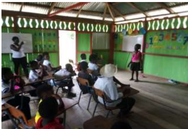
Figura 4: Sabedora en narración a estudiantes

sus costumbres propias las cuales son el alma y la razón de ser de la cultura afro lo que la hace identificar desde décadas pasadas.