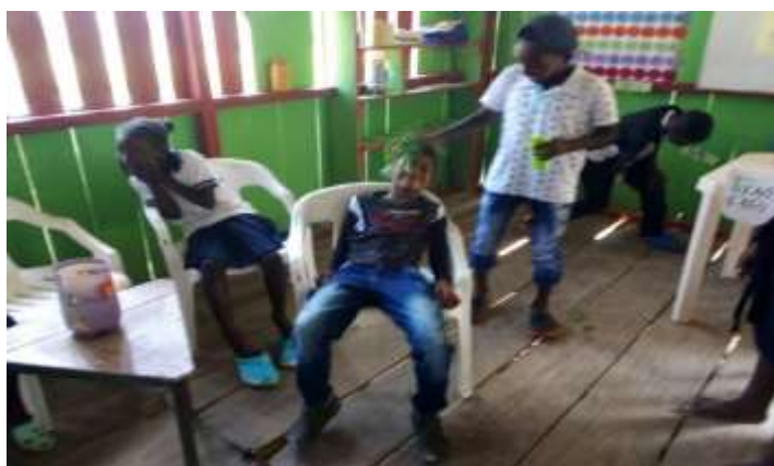
Figura 7: Dramatizada leyenda de la tunda

Se les dijo que debían tener en cuenta esta estructura al realizar sus creaciones literarias y también las historias que escucharon de las sabedoras y tener en cuenta las características para crear su propia historia, ellos se vieron felices al poner a flote su imaginación aportaban muchas ideas al interior de los grupos lo cual enriqueció su trabajo final. Luego ordenaron la información en secuencias lógicas acordes con las ideas que iban aportando finalmente unieron sus aportes organizaron, pasaron el trabajo en hojas de block y lo socializaron les divirtió escuchar las historias de sus compañeros y su capacidad para crear.