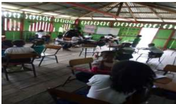
Figura 5: Estudiantes creando leyendas en grupos

Las poesías son narraciones en verso las cuales hablan de un tema determinado, pero conservando una rima y pueden abordar en estas situaciones cotidianas escogidas por el autor