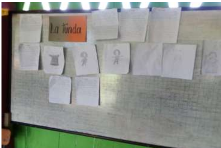
Figura 5: Trabajos realizados por los estudiantes

Seleccionar una leyenda de su región y un cuento de una región vecina que sus temas sean similares.