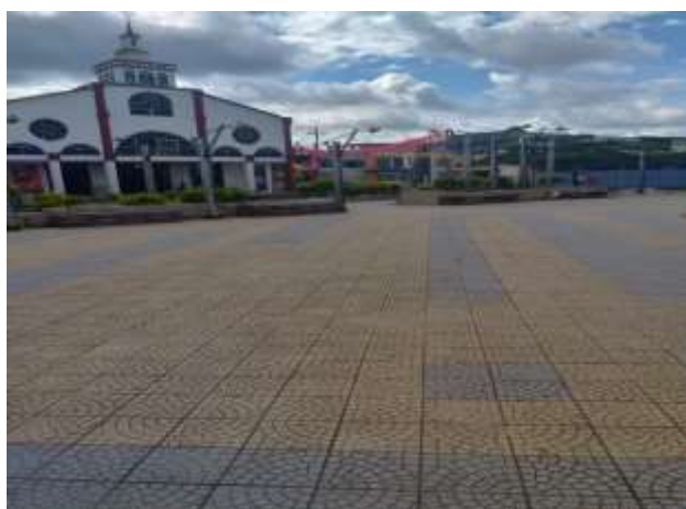
Figura 2: Plaza Central de Roberto Payan

El municipio de Roberto Payan para el año 2016 tiene una de población de 23.287, de las cuales el 94,57% pertenecen a la zona urbana, esta postura tiende a mantenerse puesto que el crecimiento poblacional de los cuatrienios no supera los dos puntos porcentuales según las proyecciones. (p.35)