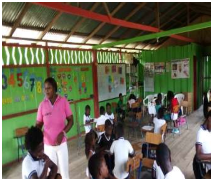
Figura 6: Trabajo en grupo (construcción de leyendas ancestrales)