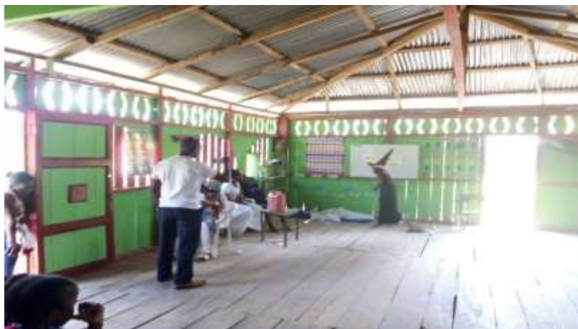
Figura 8: Dramatizada leyenda de la bruja

actividad fue la entrega de un párrafo de la leyenda de la bruja y ellos debieron terminarla con aportes desde su punto de vista o la información que recogieron del medio sobre este personaje en la cual se observó la capacidad creativa del educando, donde reflejaron motivación y deseos de continuar creando nuevas historias, en esta clase los niños y niñas fueron muy curiosos lo que generó un debate en el que hacían preguntas como: ¿a qué personas persiguen las brujas? ¿Por qué las brujas les quitan la virtud a los niños?, ¿Qué le pasa al niño si la bruja le quita la virtud? ¿Cómo se puede descubrir que una persona es bruja?, ¿Cómo se dan cuenta que la bruja le está quitando la virtud a un niño? Y así sucesivamente dieron sus hipótesis permitiendo que la clase fuera activa y dinámica