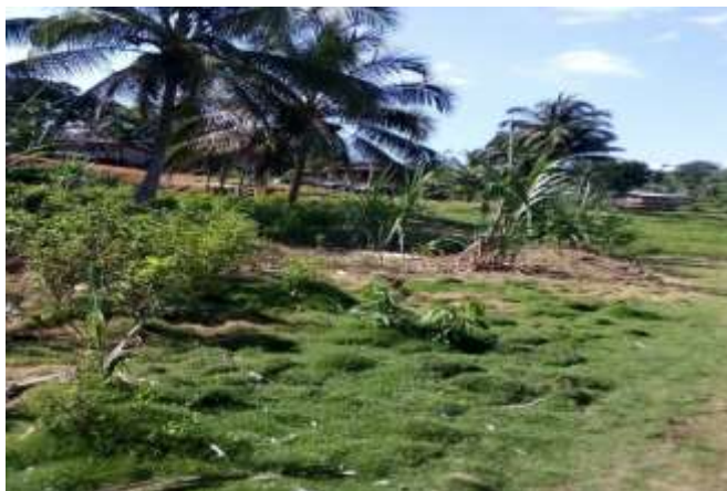
Figura 3: Vereda Brisas de Pirisito