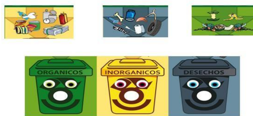
Gráfico 1 Manejo de Basuras

sostenimiento de las familias de las personas dedicadas al proyecto que hasta la fecha ha sido un éxito.