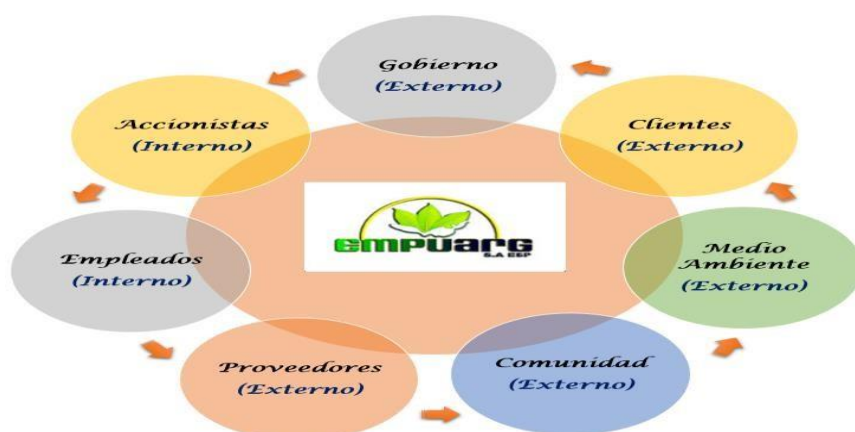
Gráfico 3 Mapa Genérico Stakeholders

En el siguiente grafico se muestra el Mapa Genérico De Stakeholders para la empresa EMPUARG S.A ESP