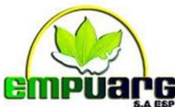
Grafico 1 logo de la empresa la empresa de servicios públicos EMPUARG S.A ESP

En el municipio de La Argentina Huila, la empresa de servicios públicos EMPUARG S.A ESP. Es la encargada de la recolección de los residuos orgánicos e inorgánicos generados por los habitantes de la zona urbana del municipio, y luego son transportados a lugar de disposición final el relleno sanitario Los Ángeles ubicado en la ciudad de Neiva, generando altos costos en el transporte y la factura de disposición final de estos residuos, los cuales pueden ser procesados y transformados en abono orgánicos y materiales reciclables para el mismo uso de la comunidad, es por esto que un grupo de mujeres Argentinas decidieron conformar la propuesta de emprendimiento social en el manejo y reutilización de los residuos orgánicos e inorgánicos generados en el municipio de La Argentina Huila.