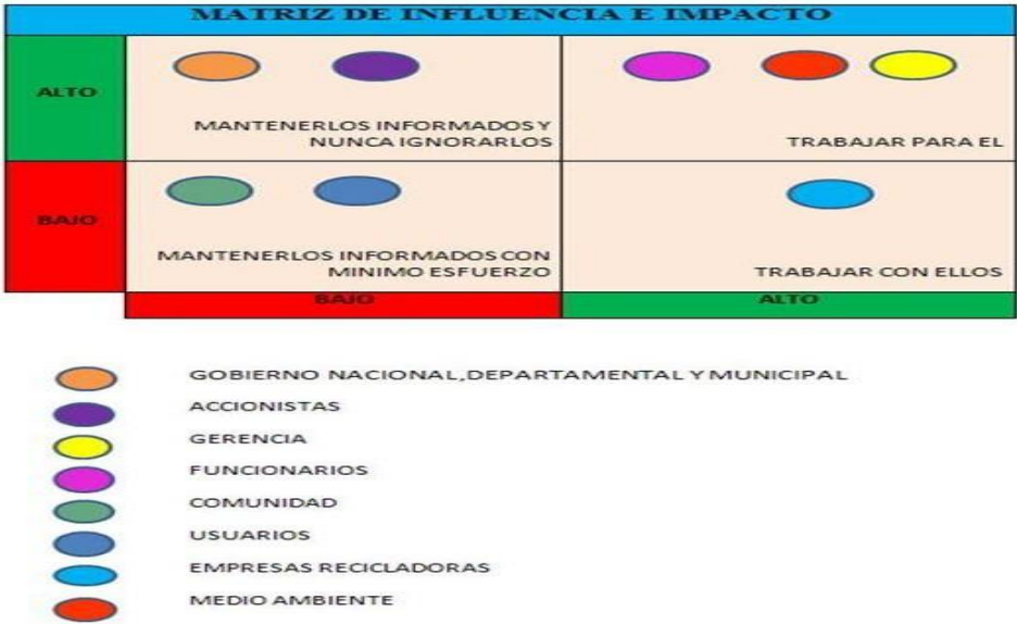
Gráfico 4 Matriz de influencia e impacto

Matriz de relaciones (Influencias vs Impacto) entre la empresa EMPUARG S.A ESP y los Stakeholders (actores) identificados