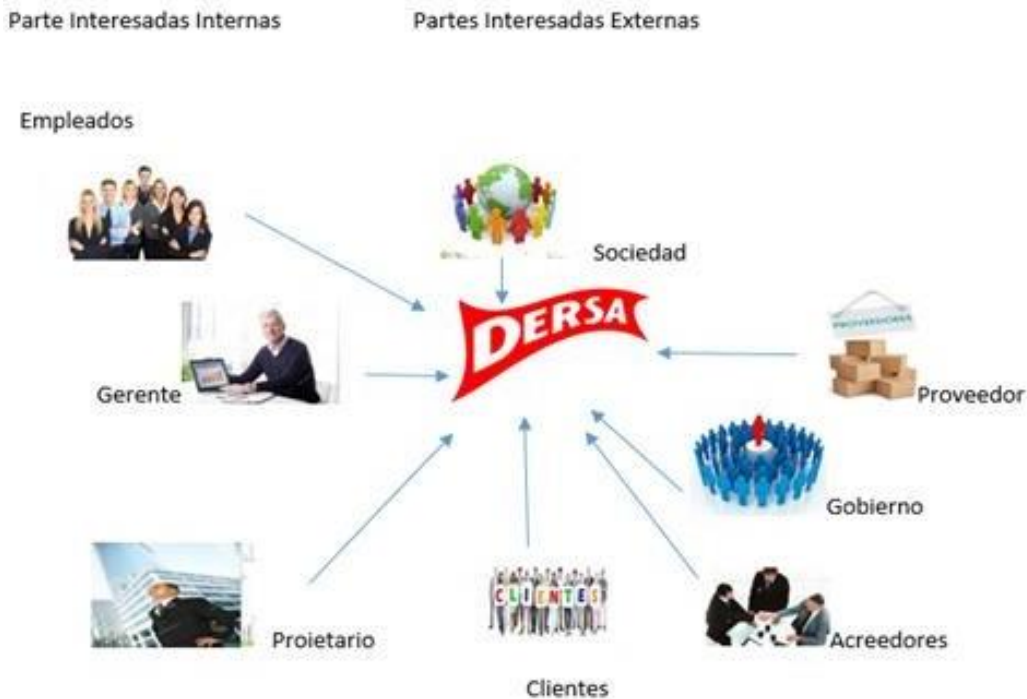
Ilustración 4 - Mapa genérico Stakeholders