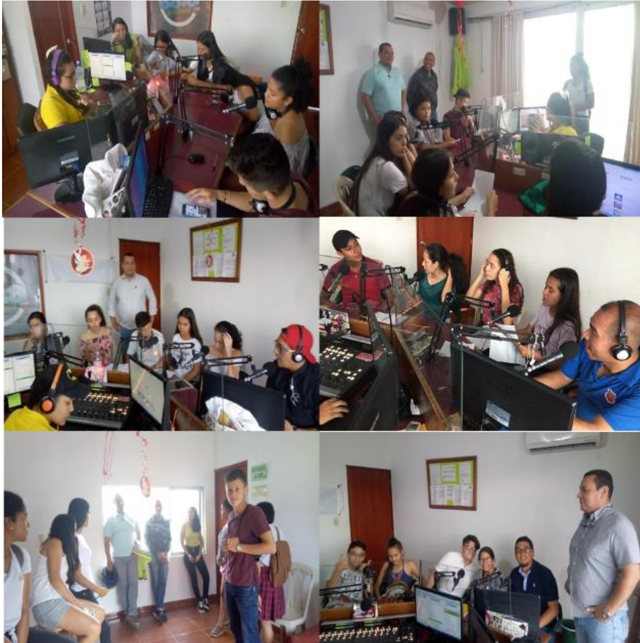
Ilustración 6. En el Estudio de la RCA 88.3 FM Acacias