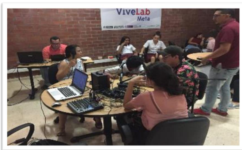
Ilustración 5. 5° Taller. Grabación de Programas para Transmisión en Diferido