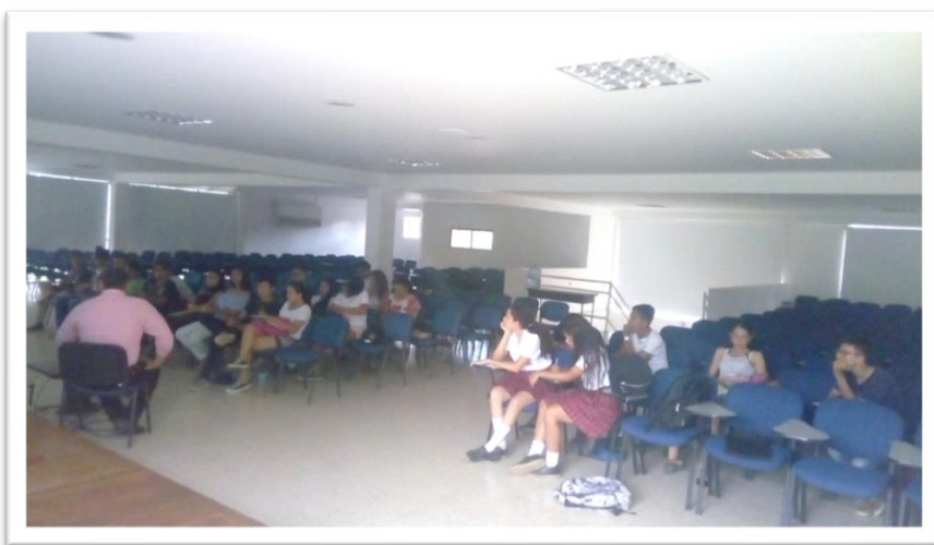
Ilustración 1. 1er Taller de Interacción con los Jóvenes Participantes.

Los jóvenes dan muestra de un gran conocimiento acerca de lo que sucede a su alrededor y a nivel nacional a través de los medios de comunicación tradicionales y masivos y las redes sociales digitales; de manera que la charla resultó ser bastante edificante, pues desde el primer momento se permitió el intercambio de saberes y el anhelo de querer saberlo todo, acerca de los conceptos estudiados y su aplicación en su cotidianidad, por parte de los jóvenes estudiantes.