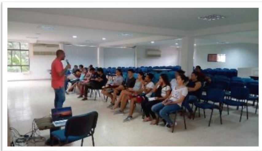
Ilustración 2. 2° Taller. Definiciones y Conceptos. Teoría Esencial.

Se logro consolidar el conocimiento de conceptos fundamentales sobre el comportamiento humano, la importancia del buen nombre y el respeto a los demas, al igual que se aprendio sobre la historia y las características de lo que es y significa la radio.