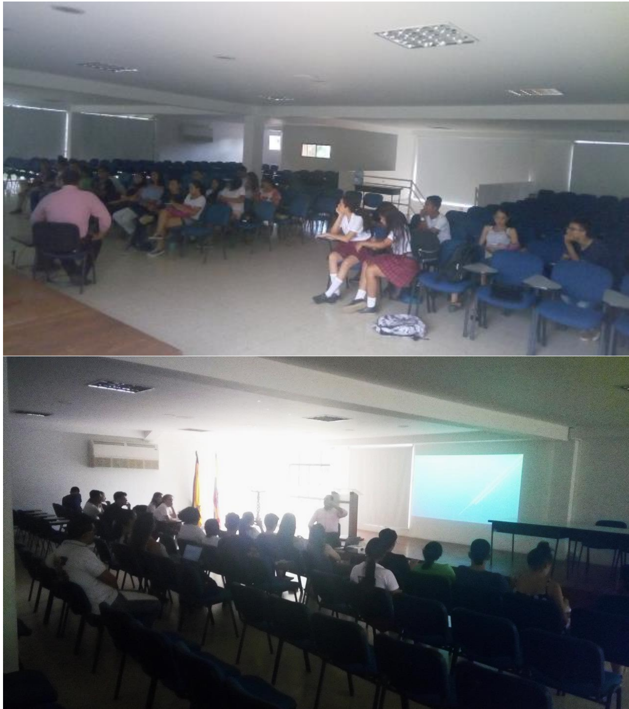
Ilustración 7. Taller 1