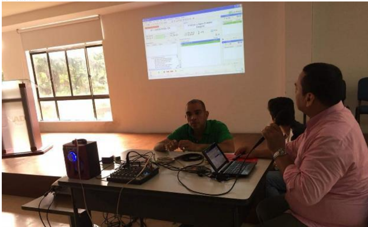
Ilustración 11. Taller 5. Grabación de Voces para Promos y Secciones del Programa en el Auditorio del CEAD de Acacías