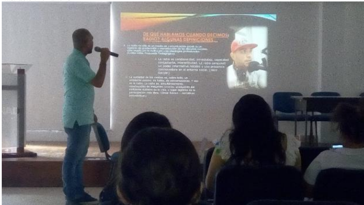
Ilustración 9. Taller 3