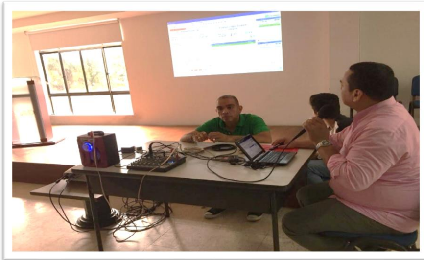
Ilustración 4. 4º Taller. Definiciones y Conceptos. Teoría Esencial