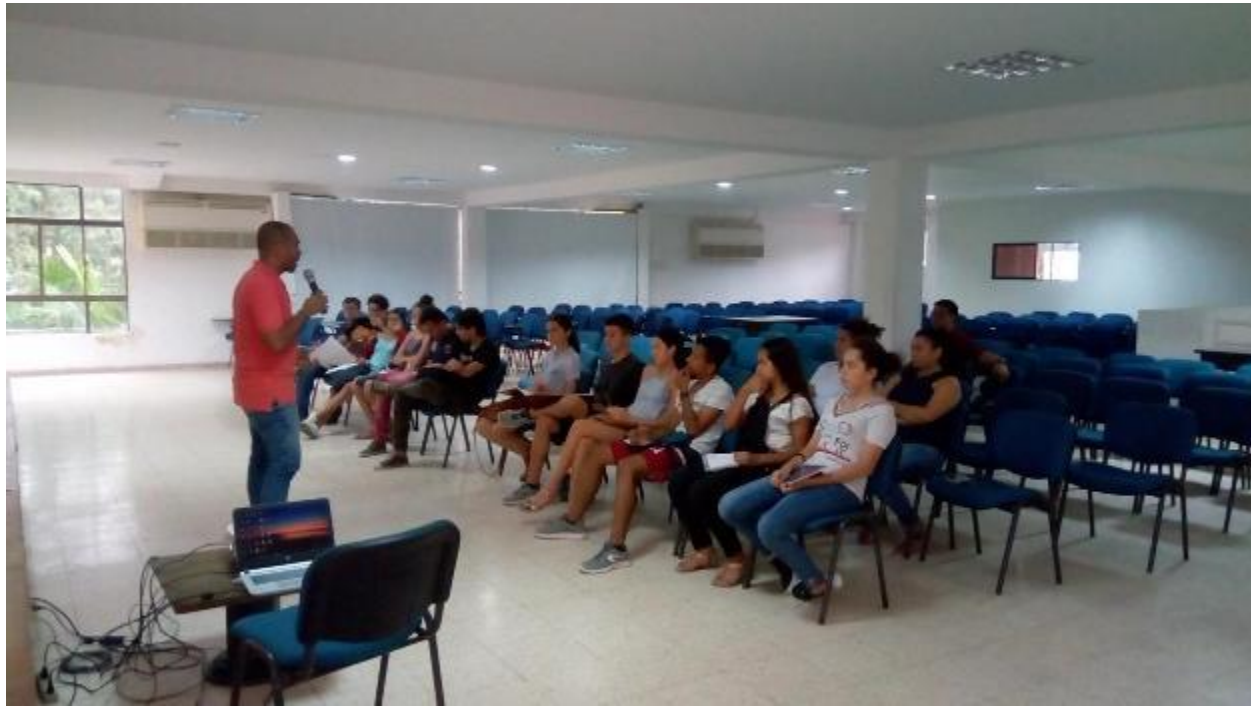
Ilustración 8. Taller 2