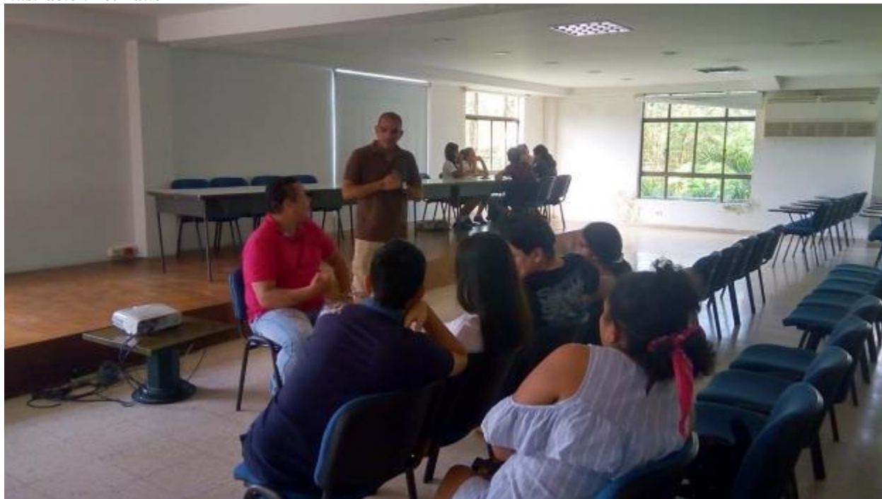
Ilustración 10. Taller 4