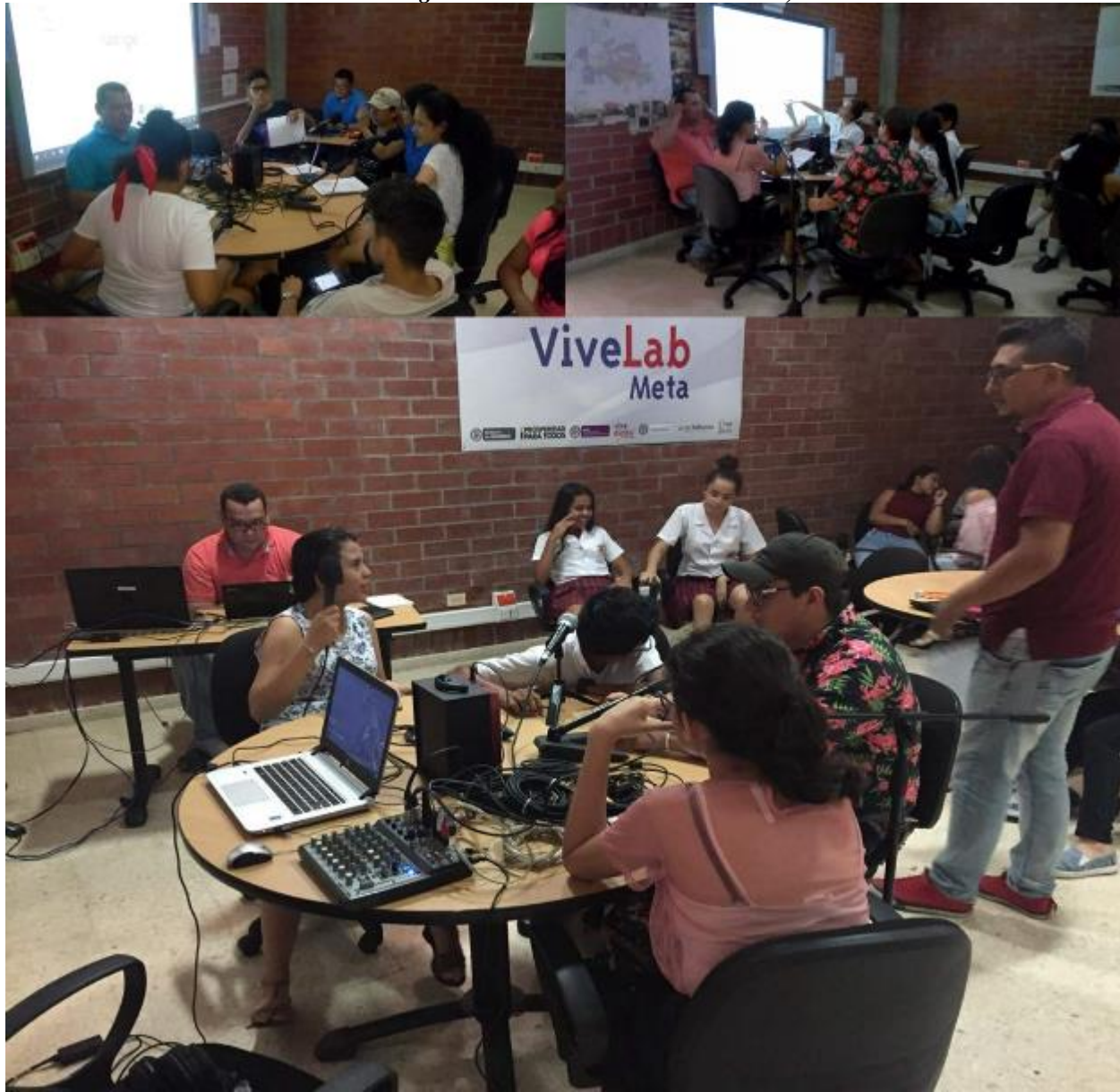
Ilustración 12. Taller 5. Grabación de Programas Decembrinos en el ViveLab 1, CEAD Acacías