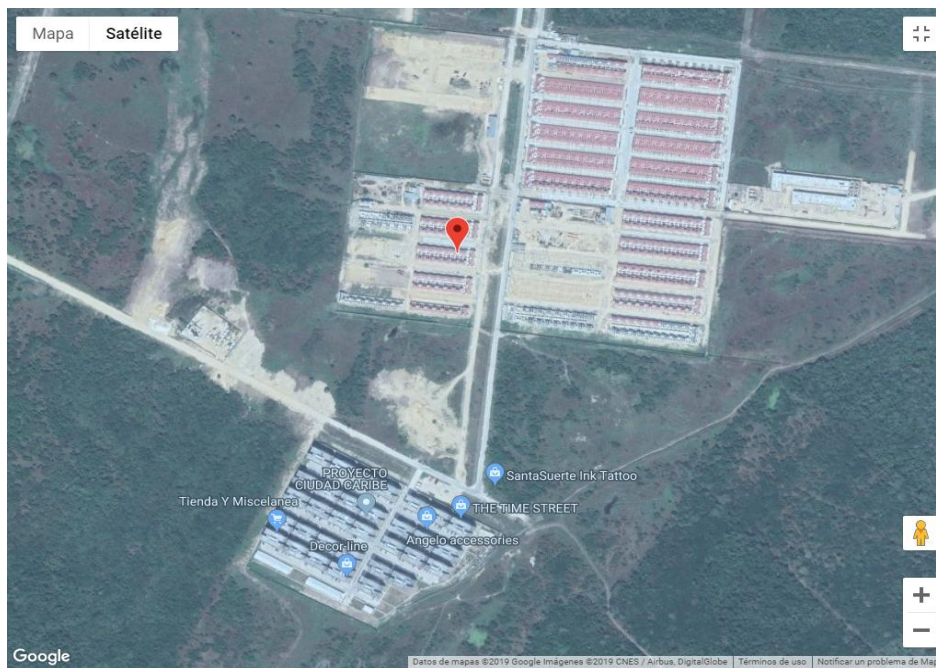
Figura 2. Ubicación del Sector Ciudad Caribe.