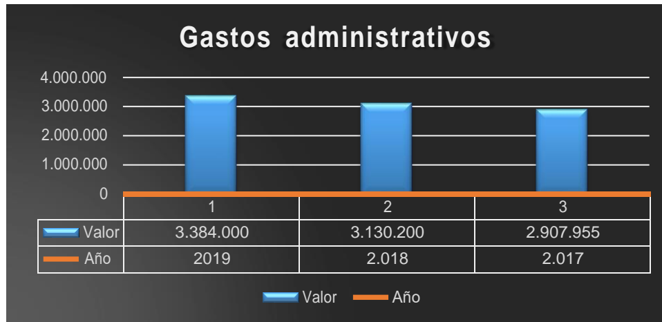
Ilustración 1. Gastos administrativos COSURCA

La figura 1 describe el comportamiento hacia el alza paulatina en los últimos tres años debido al incremento en los pagos del área administrativa de Cosurca donde no se refleja en resultados a considerar. Estos han sido producto de incrementos por encima de la inflación anual y obedece a criterios y decisiones asumidas por la Junta