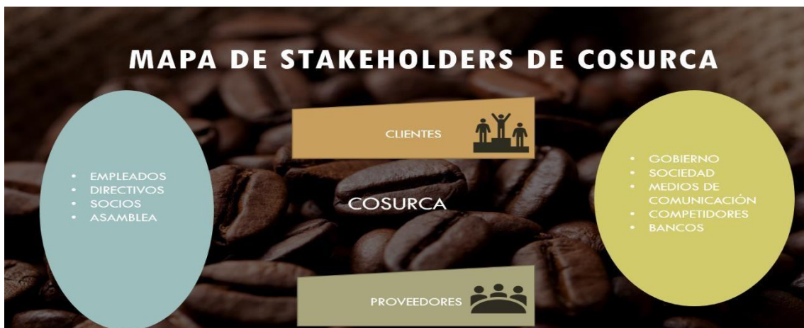
Ilustración 4. Mapa stakeholders de Cosurca

La figura 4, muestra las partes interesadas del ámbito interno y externo de la empresa Cosurca.