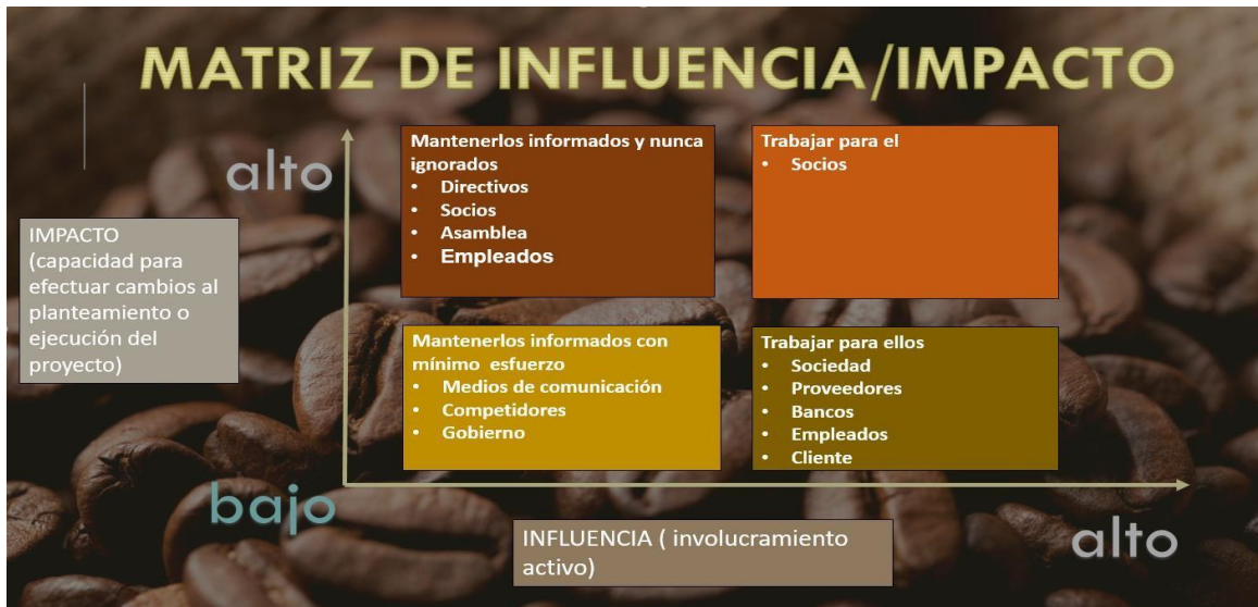
Ilustración 5. Matriz de relaciones (influencia vs. Impacto).

La figura 5, muestra el involucramiento de cada uno de los actores de la empresa, así como también la capacidad para ejercer cambios en el planteamiento de la ejecución del proyecto para Cosurca.