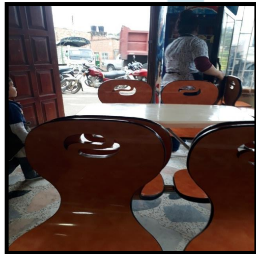
Ilustración 1 Panadería, Pastelería y Cafetería La Casa del Pan.