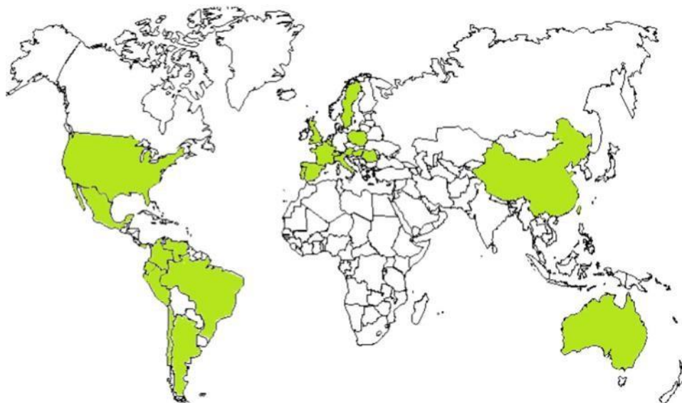
Figura 1: Ramírez,M.(2019). Países donde se enseña FpN (mapa)

años. En Europa se encuentra en países como España, Austria, Bélgica, Francia, Holanda, Hungría, Polonia, Islandia, Italia, Suecia, Suiza, Portugal, Rumanía, Gran Bretaña, etc. En Asia, está en Taiwán, República Popular China y también en Australia. En América Latina está presente en Argentina, México, Brasil, Costa Rica, Perú, Chile, Ecuador, Colombia, Venezuela”. (p.10)