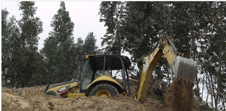
Imagen tomada por Geovanny Camargo, el 10 de Noviembre de 2019.

Corpoboyacá como autoridad ambiental, otorga las licencias y permisos o autorización de concesión de aguas, de vertimientos, de emisiones atmosféricas y también de ocupación de cauces, playas y lechos, así como proyectos de estudio y de manejo ambiental.