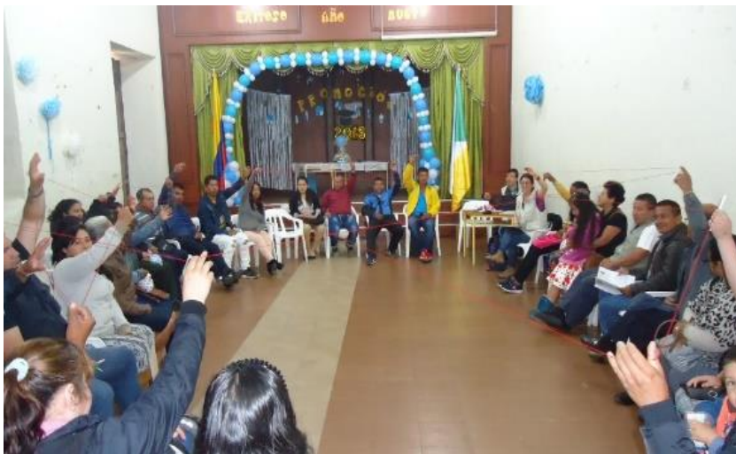
Ilustración 8. Actividad “Tejiendo vidas y Te Alcanzo”.

Cada actividad permitió identificar aspectos sociales importantes de mencionar y que a continuación se relacionan: