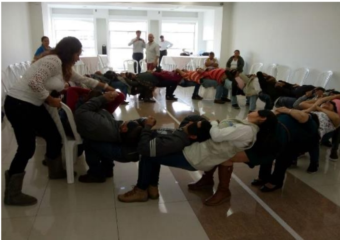
Ilustración 10. Actividad “Círculo de confianza y náufragos y salvavidas”.