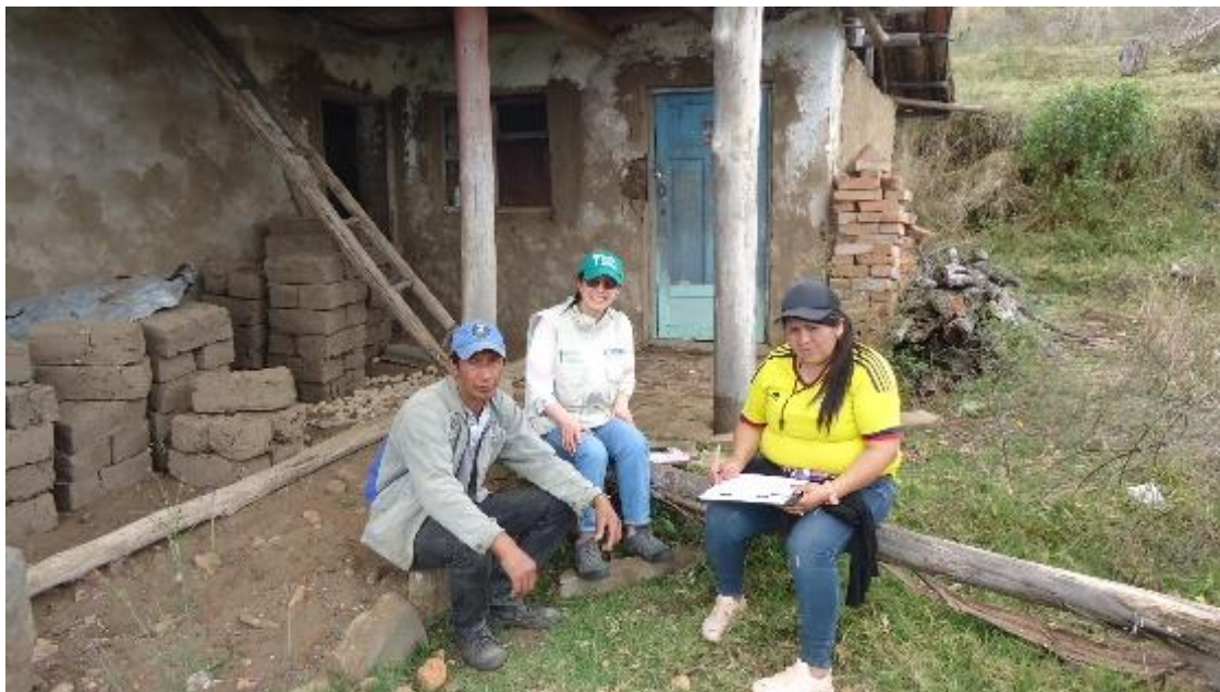
Ilustración 5. Visita de acompañamiento y verificación predial

El empoderarse de los procesos les llevo a cumplir sus sueños de poder materializar los subsidios de tierras tan anhelados por diferentes familias campesinas del departamento de Nariño, y en especial del municipio de El Tambo Nariño; la satisfacción de las diferentes familias, al obtener la resolución del proceso de materialización de los subsidios de tierras es muy gratificante el sentir que por fin obtuvieron sus tierras, para un asentamiento en un territorio determinado y con esto, sus vidas tomara otro rumbo, en un proceso de construcción de identidad, en una relación con sus raíces históricas, y su propia cosmovisión de la tierra y su sentir de ser campesinos, ya sus intereses se abarcaran por otros rumbos como por ejemplo de jornaleros a propietarios;