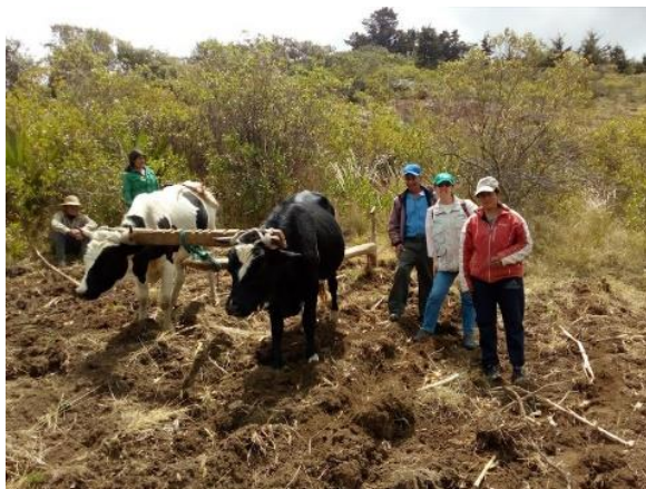
Ilustración 2. Identificación de labores productivas en predios priorizados