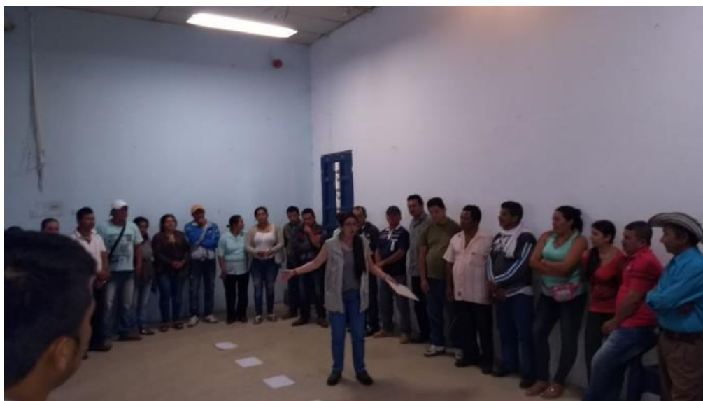
Ilustración 13. Actividad “náufragos y salvavidas y Te Alcanzo”