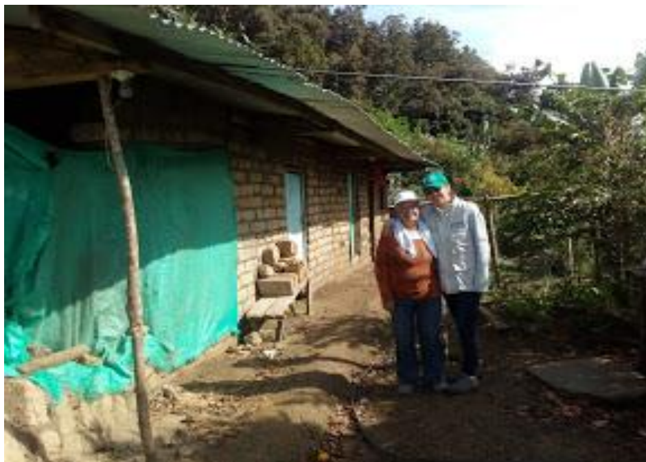
Ilustración 7. Vereda Cebadero municipio de El Tambo, vista social de seguimiento a campesinos de la zona.

En este sentido las familias participantes se muestran agradecidas por tenerlos en cuenta para este tipo de capacitaciones, ya que reiteran constantemente que el Gobierno los tiene olvidados; agradecen la oportunidad de participar en los diferentes encuentros expresan que han salido de la rutina, aprendieron otros conceptos, se integraron y apoyaron mutuamente facilitando sus contactos telefónicos o direcciones de sus casas, veredas, corregimientos, y sobre todo cada uno de los usuarios se lleva una semilla a su hogar, a su comunidad para seguir trabajando en pro de un interés común;