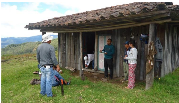
Ilustración 1. Vereda San Bosco municipio de El Tambo campesinos de la zona recibiendo información, a través de la Actividad Tejiendo Vidas.

El programa de subsidios de tierras le apostó a satisfacer necesidades sociales y modificar las condiciones de vida de las personas, con el fin de mejorar la cotidianidad de la sociedad en su conjunto, o al menos de algunas familias campesinas más desfavorecidas, tratando de beneficiar