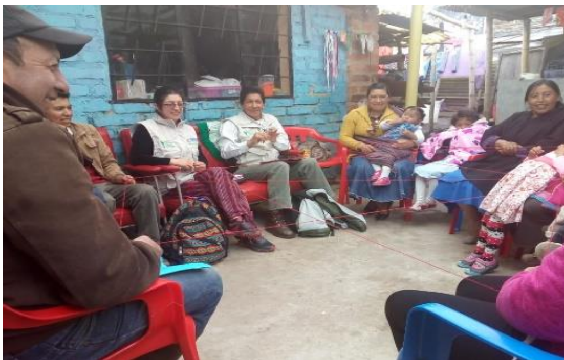
Ilustración 11. Actividad “Tejiendo Vidas”