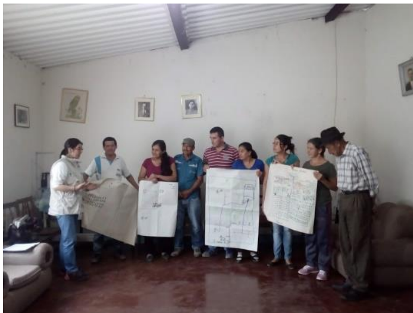
Ilustración 12. Actividad “Trabajo grupal taller GROW y cuadrado de compromisos”.