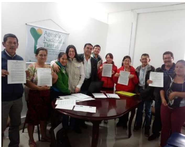
Ilustración 4. Entrega de resoluciones y asesoramiento de la tramitología para la legalización de los predios.