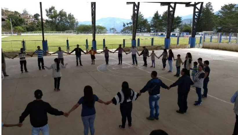
Ilustración 9. Actividad “Te Alcanzo e Hilos de Deseos”.