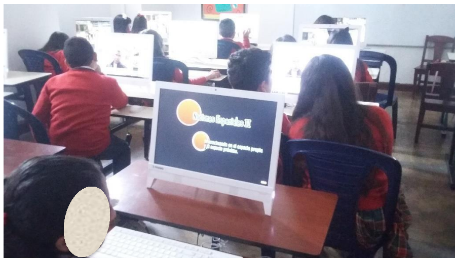
Evidencia 1. Estudiantes del Colegio Cambridge School de quinto grado en la sala de informática, observando el video: JUEGOS, TAREAS Y ACTIVIDADES: Orientación Espacial.