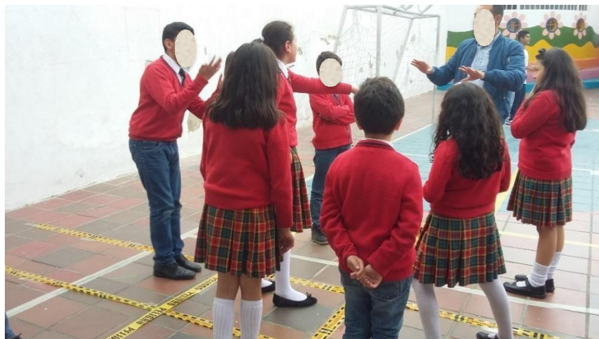
Evidencia 6. Actividad práctica II, estudiantes colegio Cambridge School, grado 5, Patio de juegos y Educación Física.