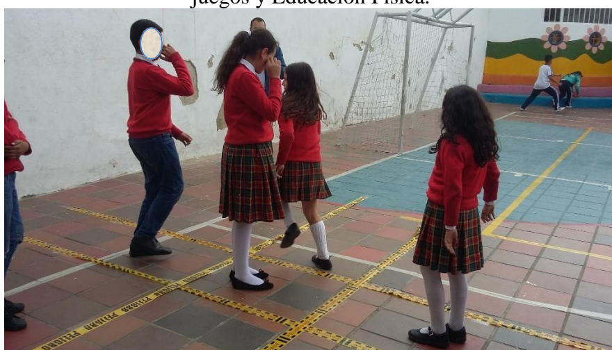
Evidencia 5. Actividad práctica II, estudiantes colegio Cambridge School, grado 5, Patio de juegos y Educación Física