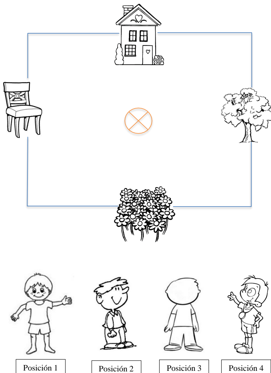
Gráfico 1. Figura de posiciones y ubicación espacial para prueba de actividad 1.

La segunda actividad de la etapa 2, consistió en llevar a los estudiantes a la sala de informática allí se les guio en el proceso de ubicación en cada una de sus estaciones de cómputo, luego se les indicó abrir un navegador de internet, en este ingresar a la plataforma YouTube, estando dentro de la plataforma de reproducción de videos en línea, se les pidió ingresar en la barra de búsqueda las siguientes palabras claves: Juegos, Tareas y Orientación Espacial II.