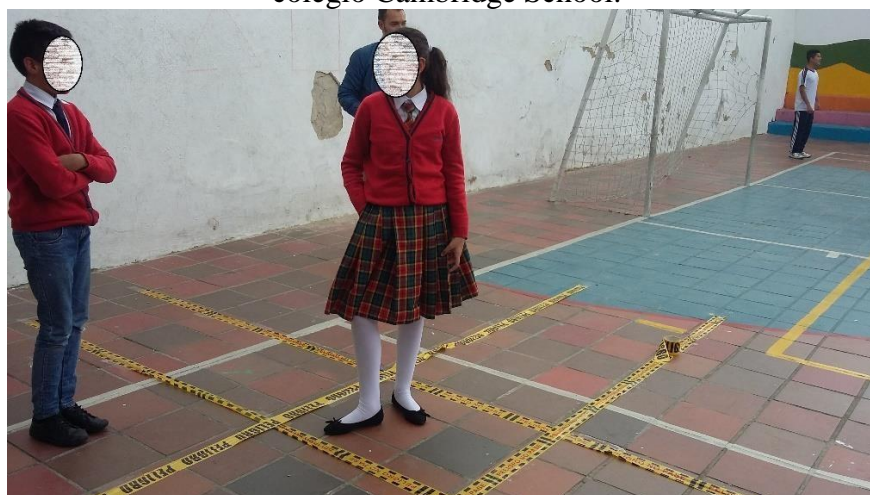
Evidencia 4. Actividad práctica I, estudiantes colegio Cambridge School, grado 5, Patio de juegos y Educación Física.