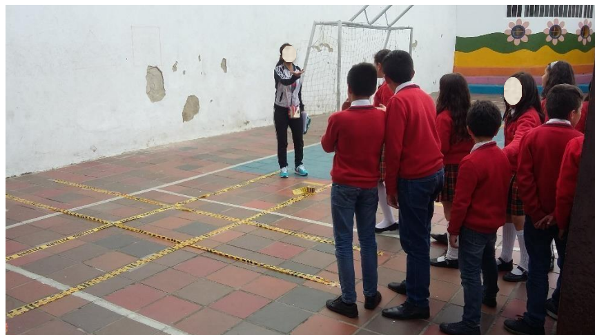
Evidencia 3. Charla introductoria a las actividades de tipo práctico, alumnos de quinto grado, colegio Cambridge School.