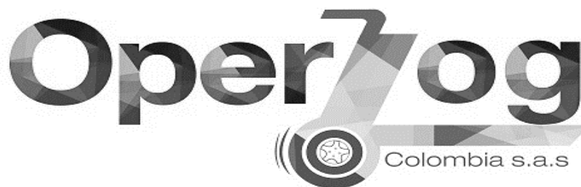
Figura 1. Imagen corporativa

Es una empresa que se dedica a la entrega de medicamentos a domicilio. Operlog Colombia S.A.S. es una empresa creada en el año 2014, con el fin de suplir las necesidades logísticas de las empresas del sector, con su objetivo de posesionarse dentro del territorio nacional, buscando especializarse en la distribución de estos productos en cortos periodos de tiempo.