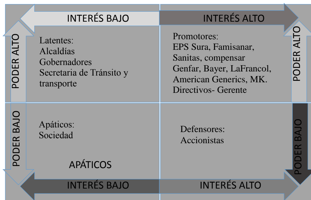
Figura 4. Matriz poder vs interés.

Con esta matriz se ubica a cada uno de los stakeholders en los diferentes escenarios en los cuales se desenvuelven.