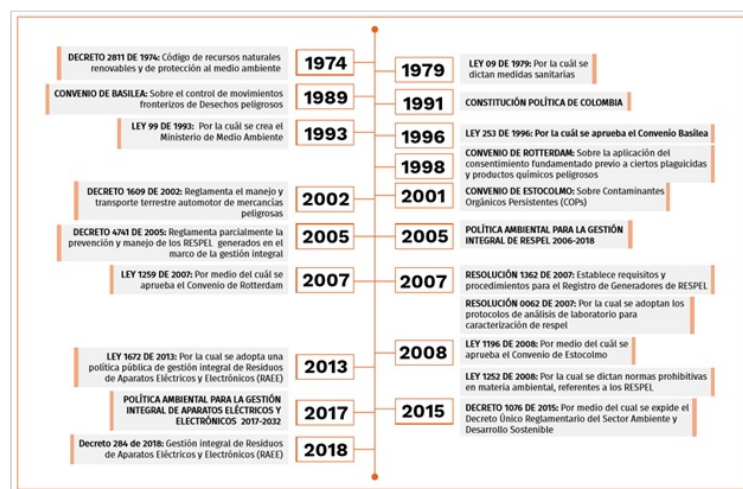
Figura 1. Resumen Normatividad Residuos Peligrosos

YENNI BOLAÑOS PEÑA 29 DE MAYO DE 2020 17:36