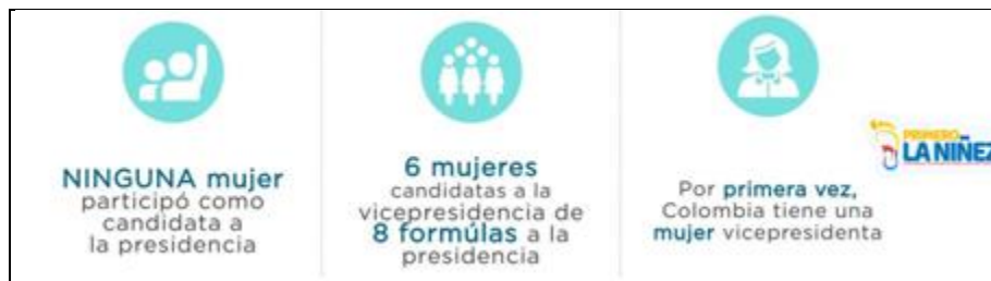
Tabla N.2. Participación en Elección de Presidente. (2018).