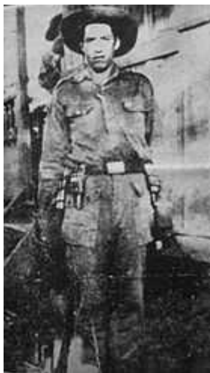
Imagen 1. Sangre Negra