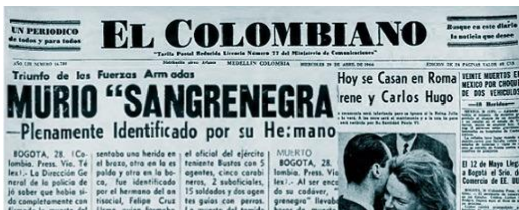
Imagen 2. Titular del periódico el colombiano murió sangre negra