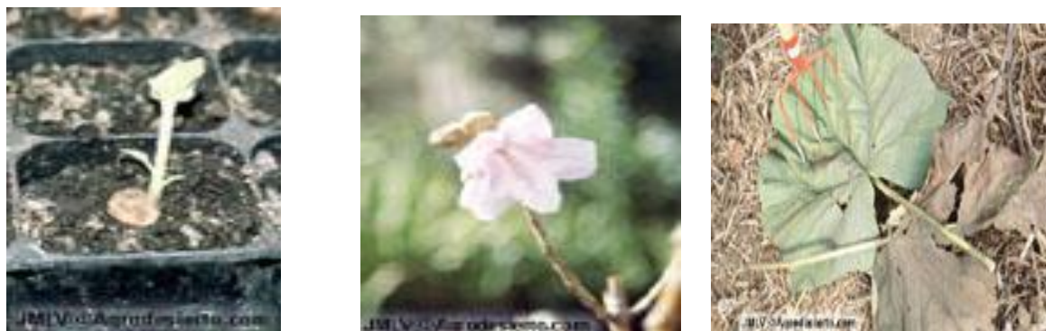
Ilustración 1 Presentación semilla y forraje inicial. Fuente: Agrodesierto, (2007).

En su caracterización morfológica, según Zhu ( et; al , 1986), sus semillas son ligeras, pequeñas y aladas, requiriendo alto nivel de luz para lograr su germinación y crecimiento, ya que esta especie no puede regenerar de forma natural bajo un dosel arbóreo; por cuanto sus hojas, Caparros, Díaz, Ariza, López & Jiménez, (2008), la caracterizan como especie caducifolia, por lo tanto presenta copa ancha y ramas de crecimiento horizontal, al igual, su color verde y gran tamaño en forma ovalada y acorazonada de 20 a 40 cm centímetros de ancho.