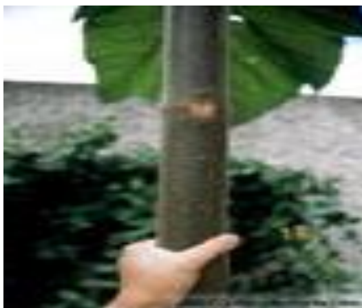
Ilustración 4 Tallo antes de dos años.

Dado que sus frutos corresponden con una capsula leñosa dehiscente de forma ovoide, puntiaguda, de 3 a 5 cm con numerosas y pequeñas semillas, la hace atractiva en la industria maderera no estructurada, es decir, para artículos livianos como puertas, ventanas, adornos, entre otros.