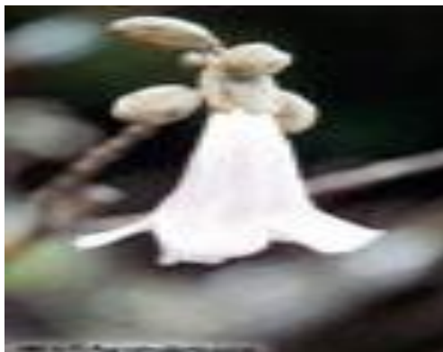
Ilustración 2. Floración temprana.

Considerado la especie propiamente dicha, la Paulownia , Zhao (1986), la describe en términos de sus principales atributos, en los cuales está su rápido crecimiento en las diversas regiones, que a diferencia de otras especies como la teca, puede alcanzar alturas superiores de los 40 cm, y al cabo de 10 años promedio, lograr un diámetro entre los 25 y 45 cm, al igual respecto a su volumen de madera puede ubicarse en los 0,3 – 0,5 m 3 .