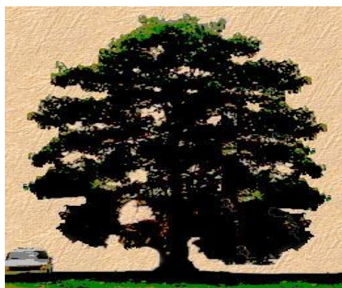
Ilustración 3 Árbol de Paulownia 10 años, 20 m. alto, 0.70 tronco.

Considerado la especie propiamente dicha, la Paulownia , Zhao (1986), la describe en términos de sus principales atributos, en los cuales está su rápido crecimiento en las diversas regiones, que a diferencia de otras especies como la teca, puede alcanzar alturas superiores de los 40 cm, y al cabo de 10 años promedio, lograr un diámetro entre los 25 y 45 cm, al igual respecto a su volumen de madera puede ubicarse en los 0,3 – 0,5 m 3 .