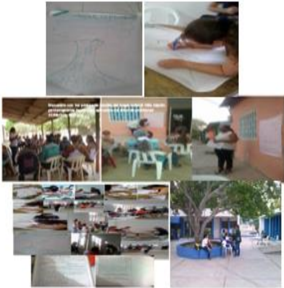
Diario de Campo.