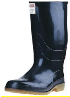
Figura 3. Imagen de Bota con punta en acero.

El (PVC) de las botas fabricadas como elemento de seguridad en varias actividades es elaborado con una punta en acero para proteger la punta del pie, como se muestra en la figura.