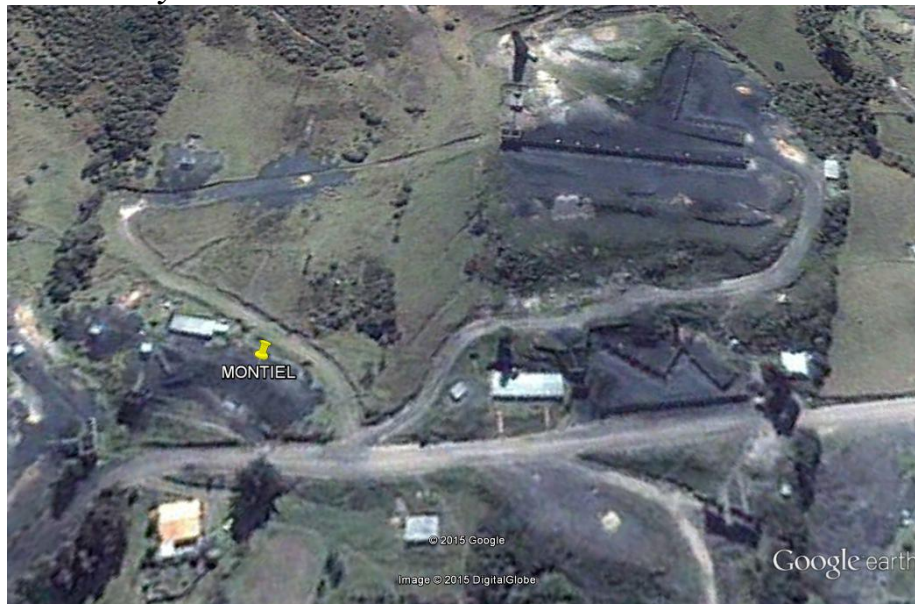
Figura 2. Ubicación y rutas de acceso