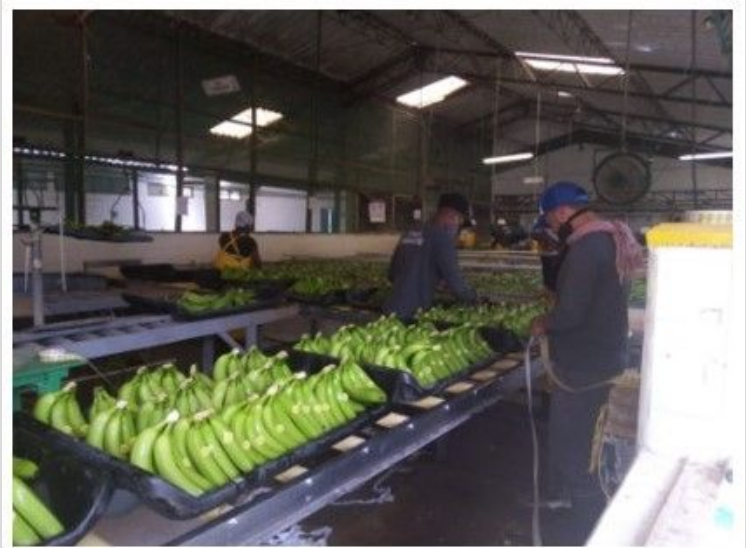
Figura 1. Proceso de Poscosecha.

Augura, Asociación de Bananeros de Colombia, y Asbama, Asociación de Bananeros de Magdalena y La Guajira, son los gremios en los que están afiliadas las principales empresas productoras y comercializadoras de banano que envían fruta a los mercados internacionales. El 78% del banano tipo exportación que se produce en Colombia corresponde a los afiliados a Augura, mientras que el 22% restante a Asbama. Adicionalmente, el Urabá antioqueño presenta un total de 35.123 hectáreas, distribuidas en 320 fincas, las cuales están mayormente afiliadas a Augura. AUGURA. (s.f.)