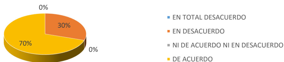
Tabla 3 Porcentaje conocimiento y utilización estilo pasivo