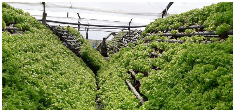
Revisar circulación del agua en los módulos