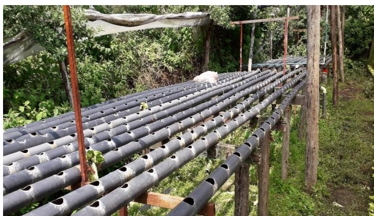
Modulos para siembra de hortalizas