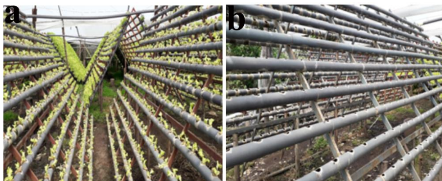
Figura 3. Sistemas de siembra para el cultivo de hortalizas en la granja Santa Cruz. a) Sistema de siembra piramidal para el cultivo de lechuga, b) Sistema de siembra lineal para el cultivo de espinaca.

Los invernaderos utilizados para la siembra de hortalizas comprenden área total de 3200 m 2 y se componen de naves de 6,80 m de ancho, 5 metros de alto y 70 m de largo con una cobertura en plástico polietileno de calibre 6. La estructura de siembra de hortalizas se compone de módulos elaborados con tubería de PVC de 2" de diámetro, de los cuales 70 módulos se destinan para el cultivo de lechuga y 2 módulos para el cultivo de espinaca.