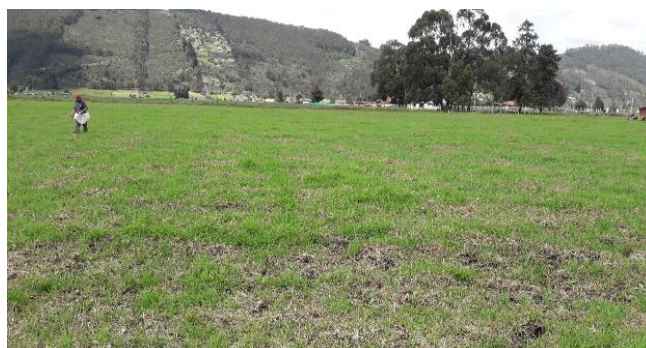
Fertilización lote de avena