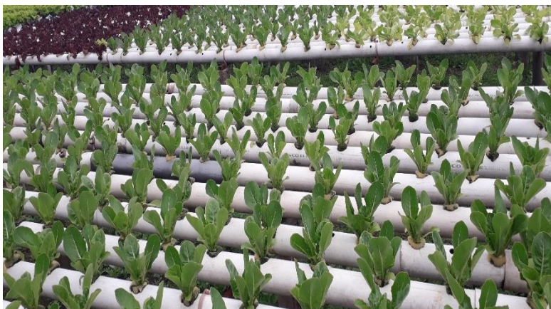
Después de Siembra