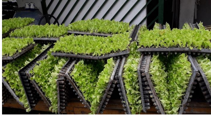
Plantulas de lechuga para siembra