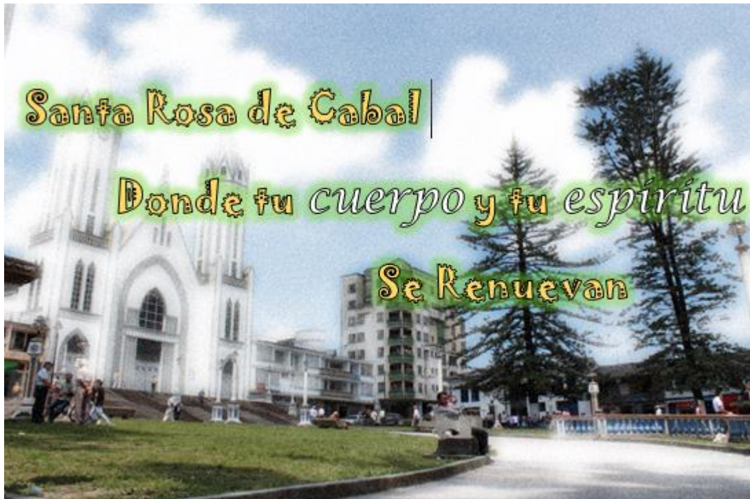
Figura 6: Slogan Propuesto Santa Rosa de Cabal