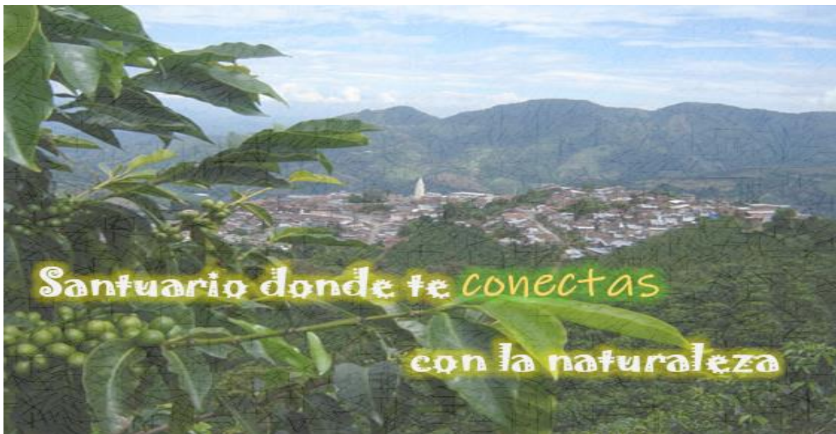
Figura 5: Slogan propuesto Santuario

“Hacer del turismo una actividad económica que genere crecimiento y desarrollo exige innovar, invertir en infraestructura y capacidades humanas y empresariales, pero sobre todo tener claro dónde, qué, con quién y para quién el turismo” Alcaldía de Pereira (2015).