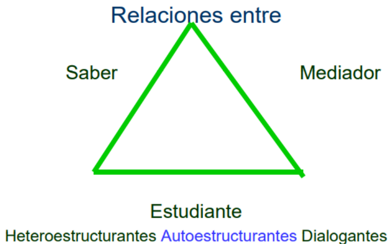
Ilustración 4 Estrategias metodológicas