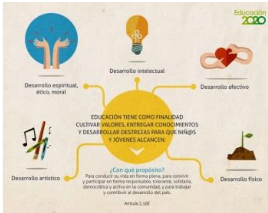
Ilustración 1 Calidad de la educación

ético, moral, afectivo, intelectual, artístico y físico, mediante la transmisión y el cultivo de valores, conocimientos y destrezas. Se enmarca en el respeto y valoración de los derechos humanos y de las libertades fundamentales, de la diversidad multicultural y de la paz, y de nuestra identidad nacional, capacitando a las personas para conducir su vida en forma plena, para convivir y participar en forma responsable, tolerante, solidaria, democrática y activa en la comunidad, y para trabajar y contribuir al desarrollo del país. (p. 3)