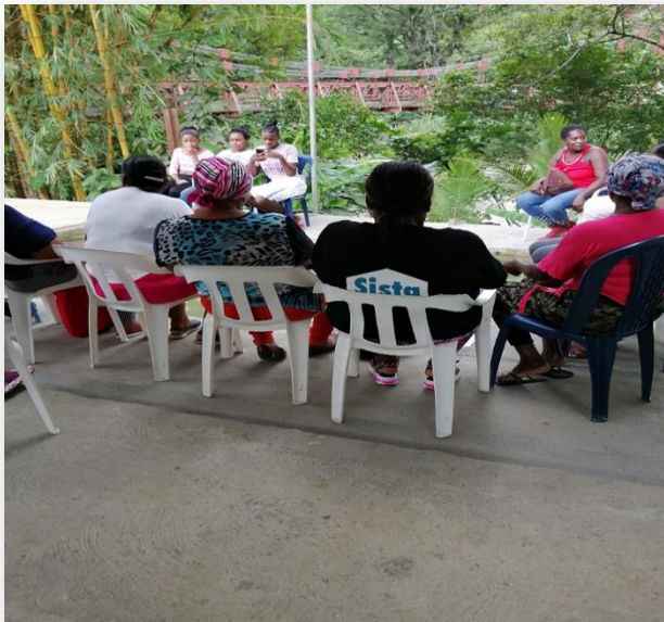
Figure 3. Observación en actividades con las víctimas del territorio, comité de la verdad.