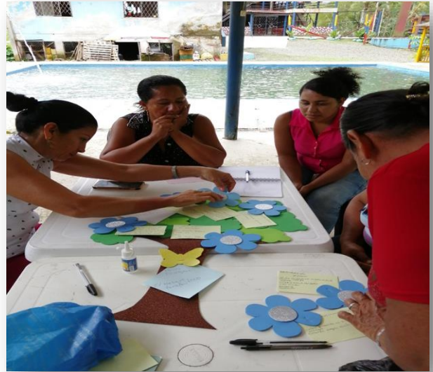
Figure 2. Recopilación de los hechos e identificación de las víctimas.