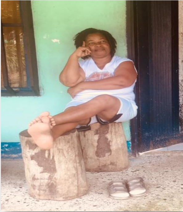
Figure 5. Víctima del conflicto armado, entrevista individual.