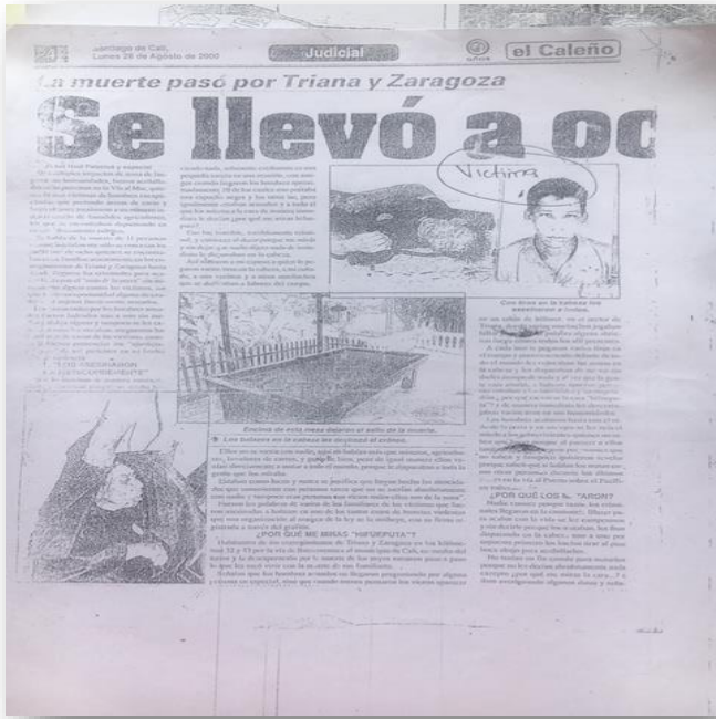
Figure 9. Noticia del periódico el caleño.