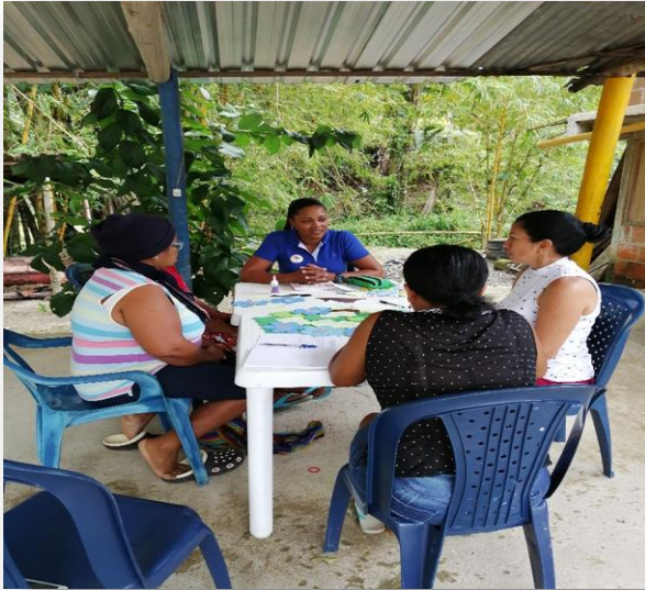
Figure 1. Primer encuentro grupal, viudas del conflicto armado