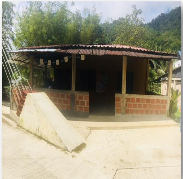
Figure 8. Lugar donde ocurrió la masacre.