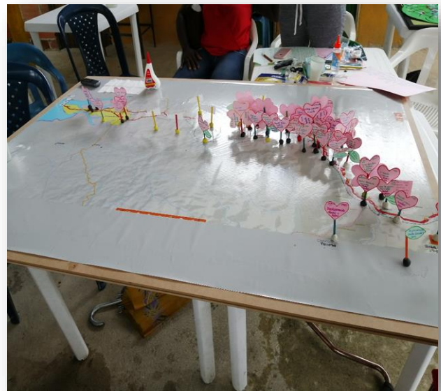
Figure 4. Observación y acompañamiento en reconstrucción de memoria histórica, comité de la verdad.