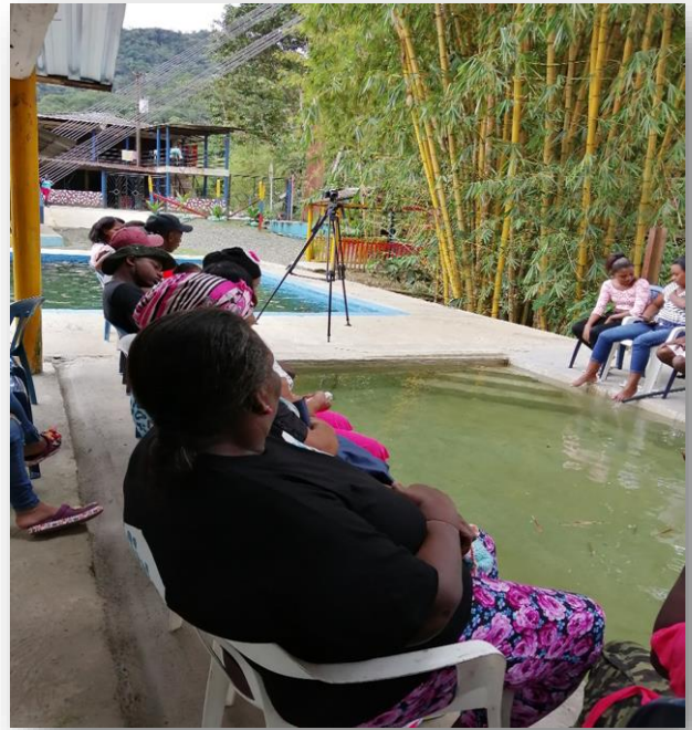
Figure 1. Grupo focal.