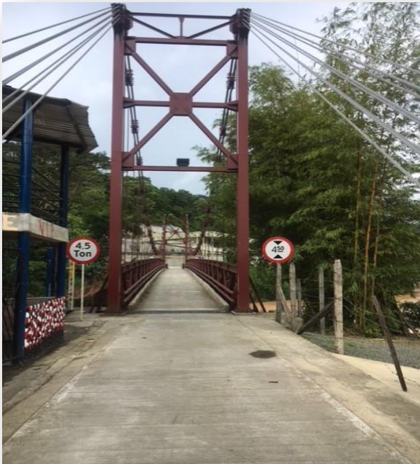
Figure 7. Entrada principal al corregimiento de Triana.