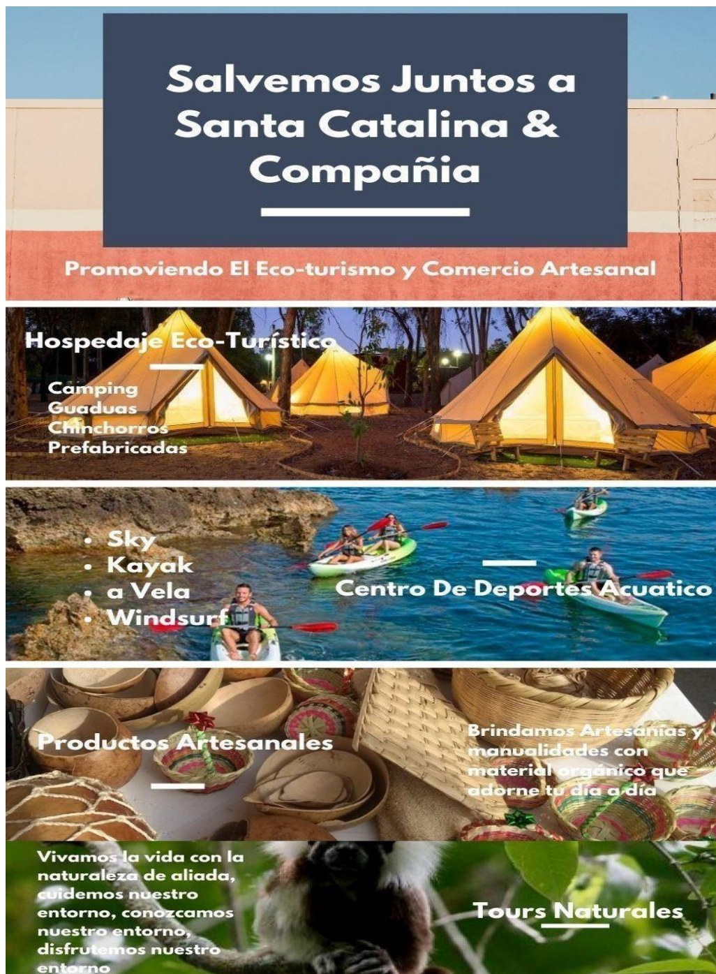
Figura 1 Herramienta o Técnica para el proceso creativo – Infografía.

Nota: La imagen describe las características del proyecto Ecoturismo Santa Catalina.