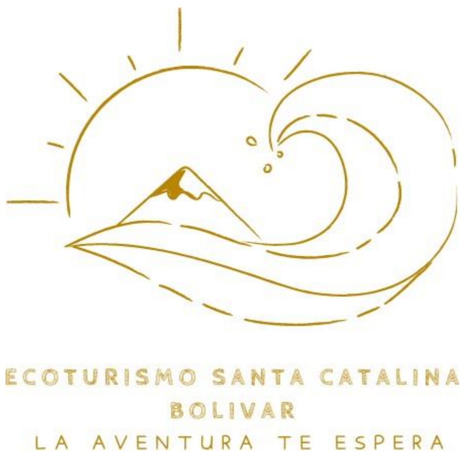
Figura 4 Imagen de la marca y slogan seleccionado.

Nota: La imagen muestra el eslogan de Ecoturismo Santa Catalina.