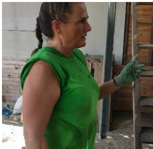
Lugar: Pueblo Orika Fecha: 26/11/2021

Perfil: Las personas humanitarias, pertenecientes a los ECH, (Eagle Condor Humanitarian), son personas, que no son discriminadoras (motivos de raza, religión, género, color u origen étnico o nacional) como también poseen cualidades de Honor, integridad, moralidad, honestidad, amabilidad y la consideración a los demás.