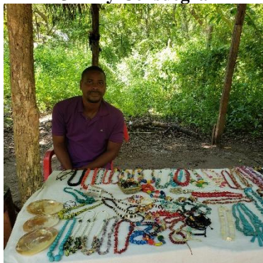
Lugar: Pueblo Orika, a orillas del Lago de los Manglares (Laguna Encantada) Fecha: 26/11/2021

Perfil de Artesano Guardabosques (de Zona Seco Tropical): sentido de pertenencia por su Pueblo Nativo (Orika), Buen trato, Buen Guía, Cuidador del Medio ambiente natural, y sobre todo de la Zona de las lagunas de los Manglares, como también buen informante sobre los avances que ha tenido la población Orika, en ayuda de la Universidad de Cartagena y del Ministerio de Medio Ambiente y de agricultura.