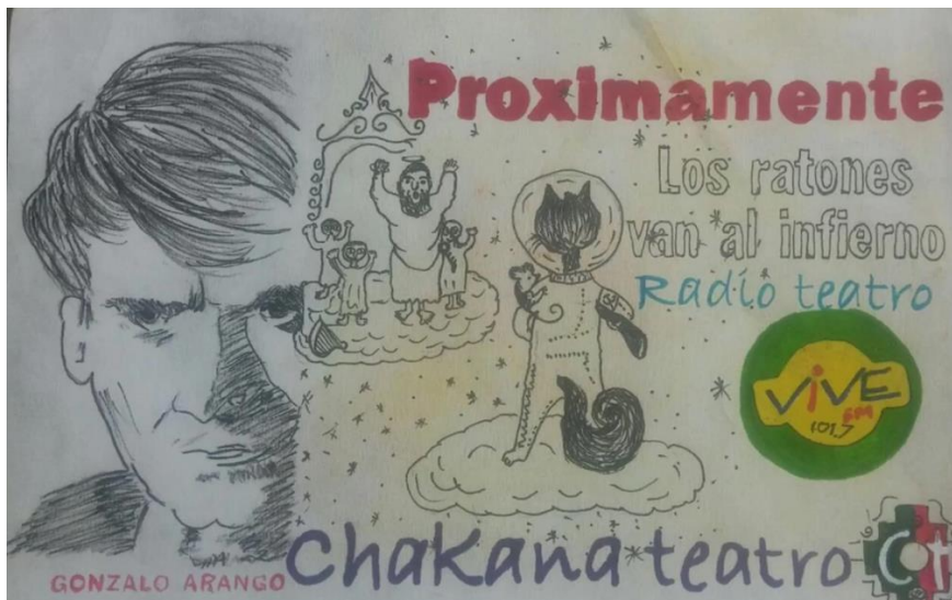
Imagen promocional de la obra de Radio Teatro Los Ratones Van al Infierno

Nota: Ilustración por Estevan Rodríguez de Chakana, comunicación personal 2020