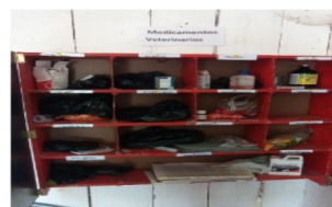
Figura 7. Medicamentos de uso veterinario en la finca la Helena