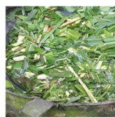
Figura 5. Observación de la alimentación de los animales en la finca la Helena