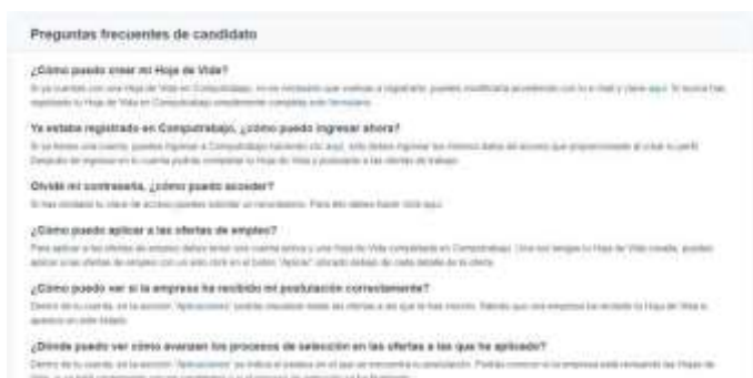
Ilustración 1. Computrabajo_preguntas frecuentes

(Garzón A. , Computrabajo preguntas frecuentes, 2022)