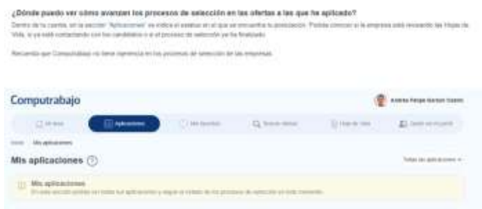
Ilustración 2. Ejemplo de link asociado correctamente

(Garzón A. , Ejemplo de link asociado, 2022)