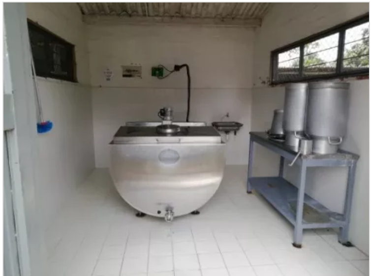
Figura 4 – Tanque de enfriamiento (Lorenn Córdoba)

LORENN CORDOBA 2 DE DICIEMBRE DE 2022 14:21 UTC