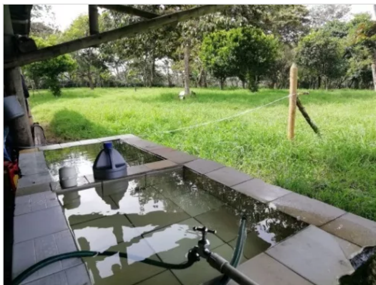
Figura 7 – Almacenamiento de agua (Lorenn Córdoba)

LORENN CORDOBA 2 DE DICIEMBRE DE 2022 14:23 UTC