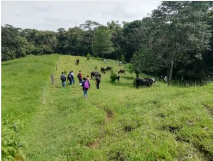
Figura 10 – Evidencia Visita (Lorenn córdoba)