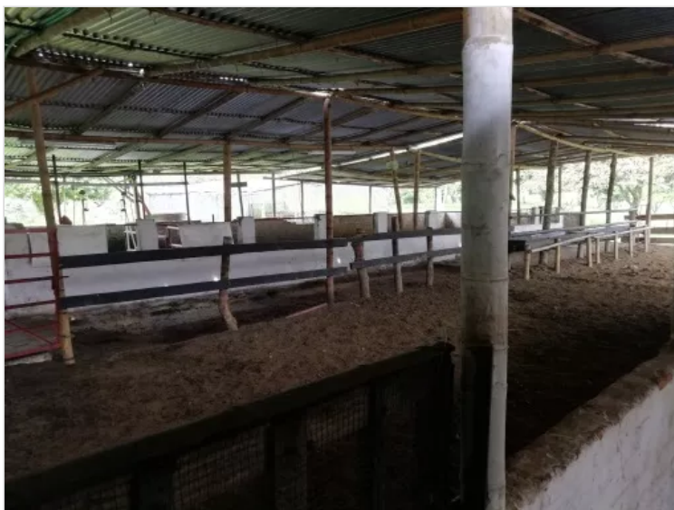
Figura 6 – Establos (Lorenn Córdoba)

LORENN CORDOBA 2 DE DICIEMBRE DE 2022 14:22 UTC