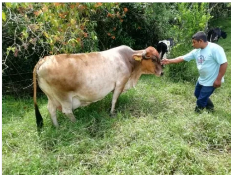
Figura 8 – Potreros de aislamiento (Lorenn Córdoba)

LORENN CORDOBA 2 DE DICIEMBRE DE 2022 14:23 UTC