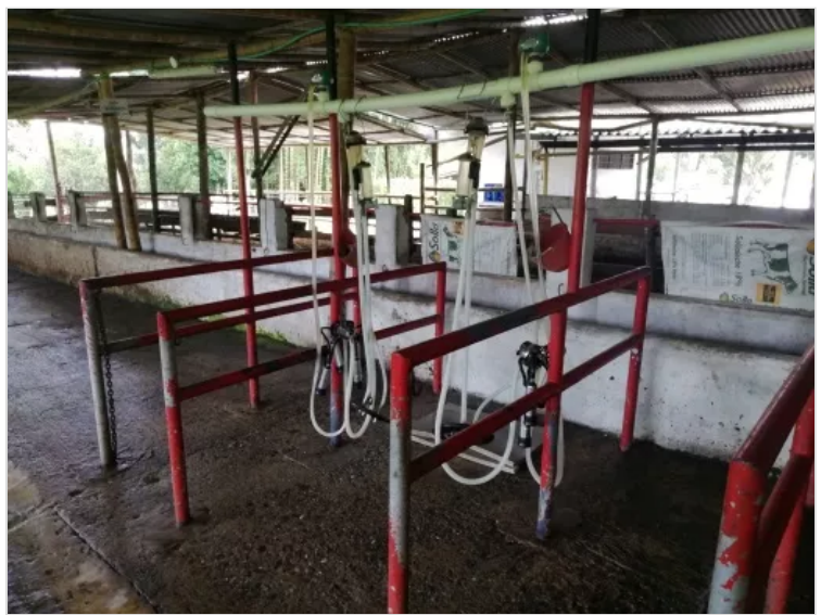
Figura 3 – Ordeñadora mecánica (Lorenn Córdoba)

LORENN CORDOBA 2 DE DICIEMBRE DE 2022 14:21 UTC