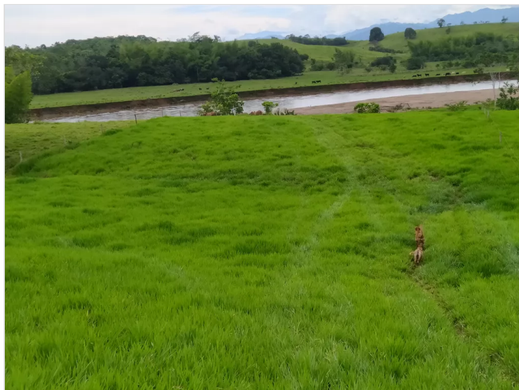
Figura 9: Hernández, F. (2022), Pastura, Predio Santa Teresa

Las instalaciones de alojamiento de personal deben tener las mínimas características de confort (cocina, baños, mesas, aéreas de descanso digno, etc.).