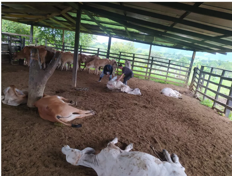
Figura 8: Hernández, F. (2022), Están de Medicamentos, Predio Santa Teresa.

Figura 7: Hernández, F. (2022), Marcación de Animales de Manera Individual, Predio Santa Teresa.