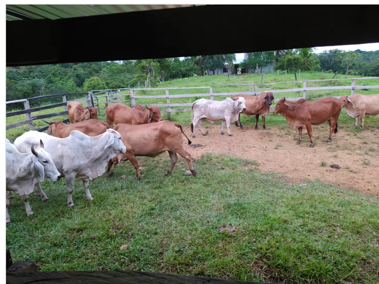
Figura 2: Hernández, F. (2023), Ganado de carne, Finca Predio Teresita.