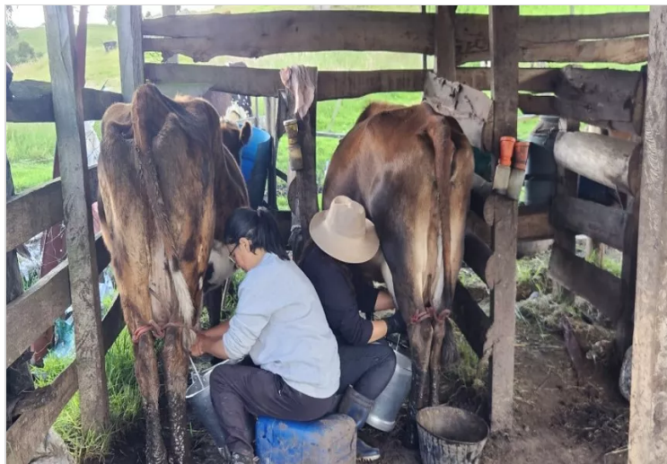
Figura 5. Rojas Y, (2022) instalaciones de ordeño, finca el triángulo Carmen de Carupa. [fotografía]

eviten estas zonas de encharcamiento alrededor de la zona de ordeño.