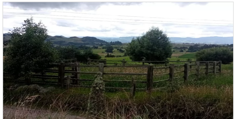
Figura 2. Rojas Y, (2022) Corral de cuarentena finca el triangulo. [fotografía]

Realizar visita a la finca “ABC El Triángulo” del municipio de Carmen de Carupa, para identificar el proceso de evolución en cuanto a la certificación de Buenas Prácticas Pecuarias.