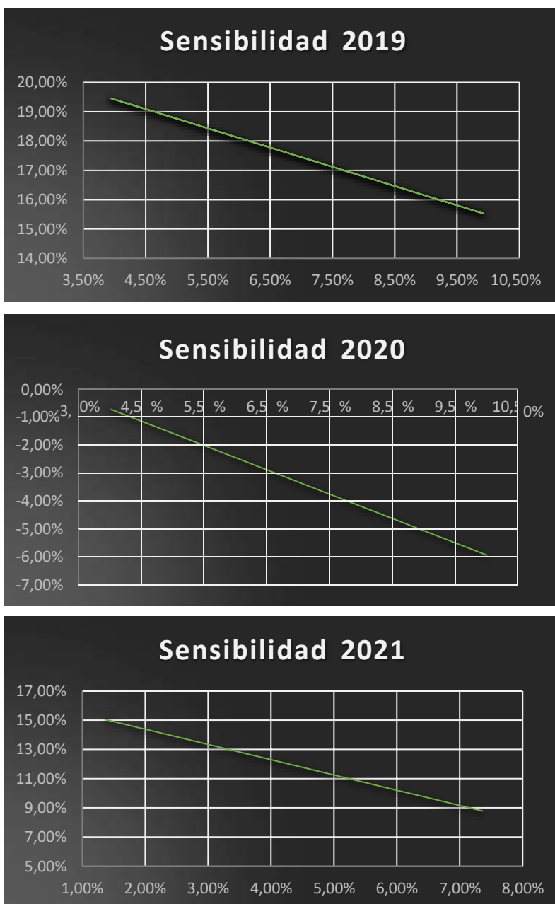
Figura 5. Análisis de sensibilidad