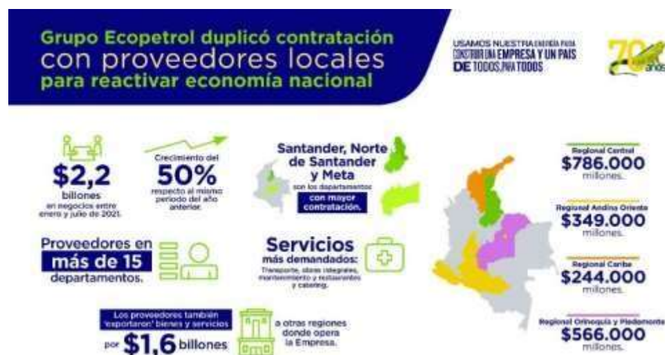
Figura 3. Proveedores

“Regional Orinoquía y Piedemonte (Meta, Casanare y Arauca): $566.000 millones con proveedores locales de Villavicencio, Guamal, Tame, Castilla La Nueva y Acacías, principalmente en obras integrales, construcción y mantenimiento de tanques, servicio de soldaduras, entre otros.” (Valora Analitik, 2021)