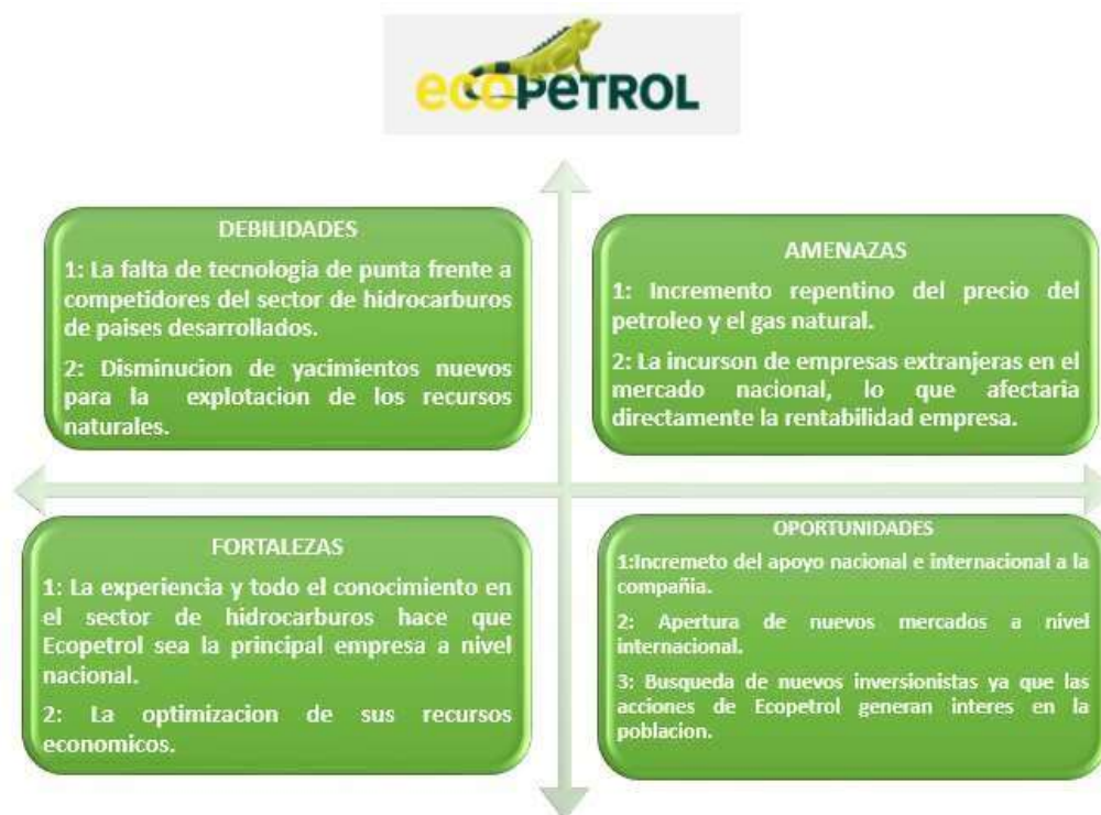
Figura 4. Análisis DOFA

Al realizar el análisis de la situación estratégica y competitiva de Ecopetrol, se obtuvieron las siguientes debilidades, oportunidades, fortalezas y amenazas: