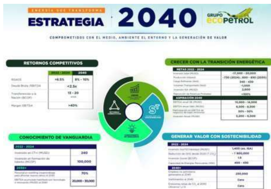
Figura 2. Estrategia 2040.

La estrategia 2040 lanzada por Ecopetrol denominada “Energía que transforma” la cual busca responder a los retos ambientales y sociales de tal forma que se genere un equilibrio y la entidad pueda seguir generando ganancias según como se refleja en la figura 2 Estrategia 2040.