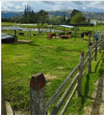
Figura 2. Barreto, A (2022) Hacienda el paraíso (Fotografía)

escases de forrajes verdes. Al comparar la lista de chequeo con lo encontrado en la hacienda se encontraron muy pocas falencias que están relacionadas con la falta de capacitación al personal y falta de mantenimiento a las instalaciones dentro de las falencias que encontré hace falta más registros, falta hacer mejor limpieza de malezas y otros subproductos en algunas instalaciones en parte debido al cambio continuo de personal y no hay un administrador constante. Por lo demás encontré una excelente genética de animales puros ayrshire registrados en la asociación ,realizan una rotación adecuada de praderas principalmente con raigrás y kikuyo, siembran pasto de corte para ensilar avena, maíz ,alfalfa, etc., que se suplementa en sala de espera y luego en la sala de ordeño se suministra ración de concentrado , se realiza una adecuada rutina de ordeño que garantiza una leche de alta calidad que va al tanque frio para ser entregada a alpina empresa que recoge la leche todos los días. La instalación sala de ordeño y sala de espera se lavan todos los días algunas excretas van directo al biodigestor y otras al compost, por otro lado, los residuos inorgánicos son almacenados para entregar al carro recolector una vez al mes.