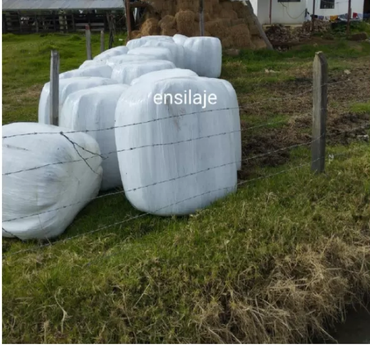
Figura 4. Barreto, A (2022) conservación de forrajes hacienda el paraíso (fotografía)