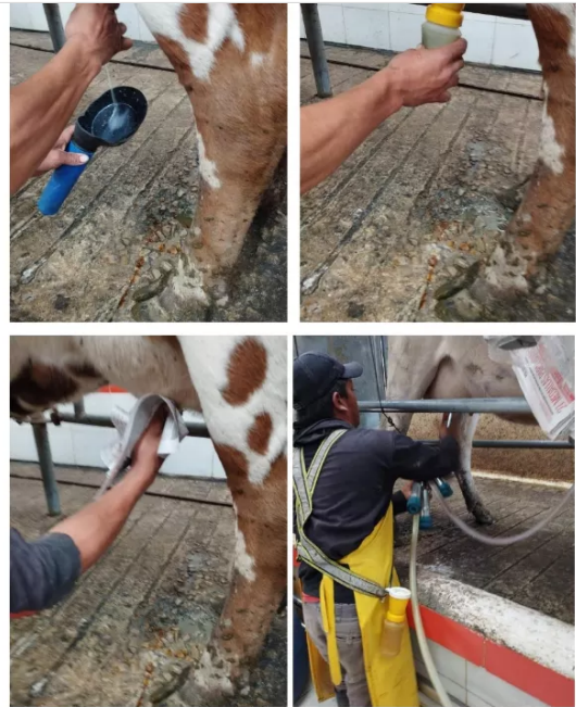
Figura 3. Barreto, A (2022) Rutina de ordeño (fotografias).

garantizan la buena calidad de la leche, entre estos tenemos despunte, pre sellado, limpieza de pezones, ordeño y por ultimo sellado , luego pasan al establo y apenas se termina el ordeño regresan todas las vacas al corte para el pastoreo , cada rutina dura 1 hora y media aproximadamente.