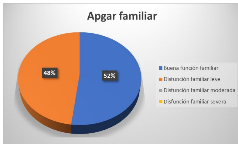
Figura 4. Apgar familiar

En la aplicación a un miembro de las 75 familias de la muestra se encuentra 39 familias con percepción de una buena función familiar, equivalente a un 52% de la muestra, 36 familias con una disfunción familiar leve, equivalente al 48% de la muestra y no se encuentran familias con una percepción de familias con disfunción familiar moderada o severa.