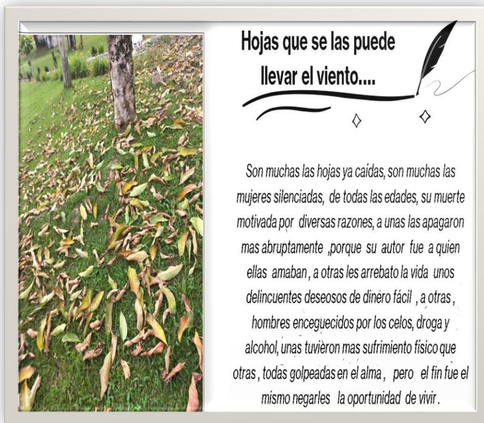
Foto tomada en el Parque Cementerio "La Inmaculada" de La Unión Nariño. Imagen reflexiva sobre la violencia de género. Hojas que se las puede llevar el viento. Marzo 12 2023.

Hojas que se las puede llevar el viento. Violencia de género.