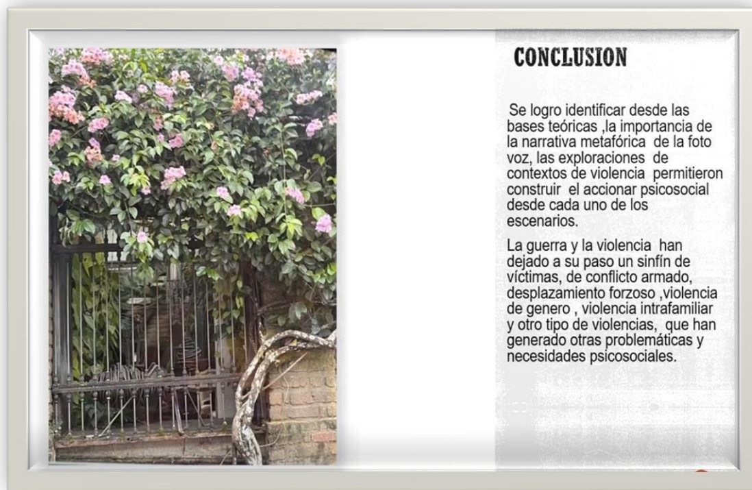
Foto tomada. Imagen reflexiva sobre la violencia de género. Sólo Flores. Marzo 12 2023. Por Valdés Belalcazar.MP