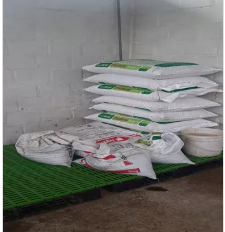
Figura 4. Fertilizantes.

La finca no maneja sistemas de estabulación, fertiliza praderas con agroquímicos autorizados por el ICA, además de sistemas tradicionales de fertilización con la bovinaza de la finca.