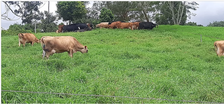
Figura 3. Praderas Agropecuaria Andalucía.

El haberse acogido a el cumplimiento y certificación ICA en BPG, les ha permitido tener sistematizado todo su proceso de alimentación animal, logrando una alta eficiencia en los sistemas utilizados para la rotación de potreros, lo cual ha podido aumentar gradualmente su carga animal al disponer de buenas cantidades de forraje, también mejorando de paso la calidad y el bienestar de los animales de la finca.