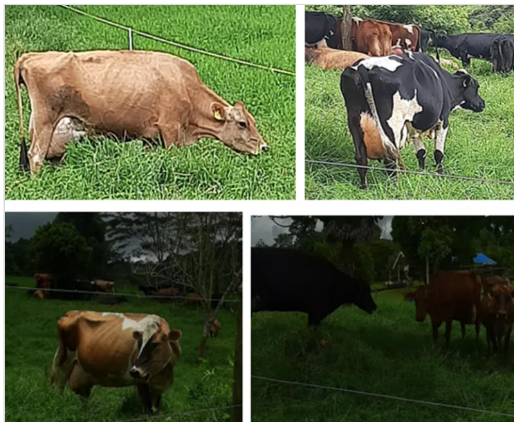
Figura 9. Ganadería.

La calidad de la leche del ganado Jersey la cual es reconocida en el mercado por su calidad en la cantidad de grasa, proteína y contenido mineral, sumado a su mansedumbre, fertilidad se asocia de manera adecuada con la característica genética del ganado Holstein el cual la clasifica como una de las mejores productoras en cantidad de leche producida, por lo cual la Agropecuaria Andalucía optó por incluir en su producción este tipo de ganadería, lo cual ha sido un éxito en la producción.