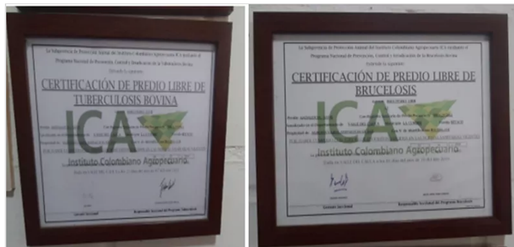
Figura 6. Certificaciones ICA.