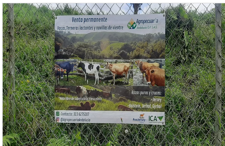
Figura 1. Localización Agropecuaria Andalucía.

DANIEL RODRIGUEZ RUBIO 14 DE MAYO DE 2023 23:22 UTC