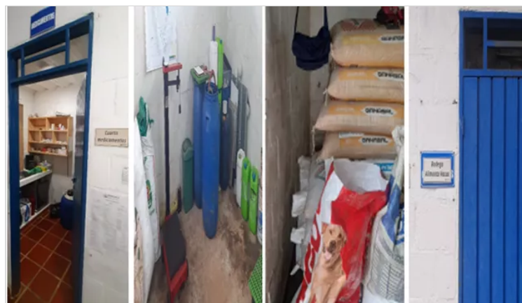
Figura 7. Almacenamiento.

Las buenas practicas pecuarias y la normativa ICA, exige ciertas condiciones de almacenamiento de los diversos procesos que se llevan a cabo en una producción, desde el proceso documental, alimentos, medicamentos, insumos agroquímicos, producto terminado y demás, exigen un correcto manejo en cada caso específico. Cumplir con todos los protocolos establecidos en cada caso, garantizan una excelente calidad en el producto final y genera una garantía de contar con productos correctamente ordenados y clasificados, certificados y vigentes en los sistemas de calidad.