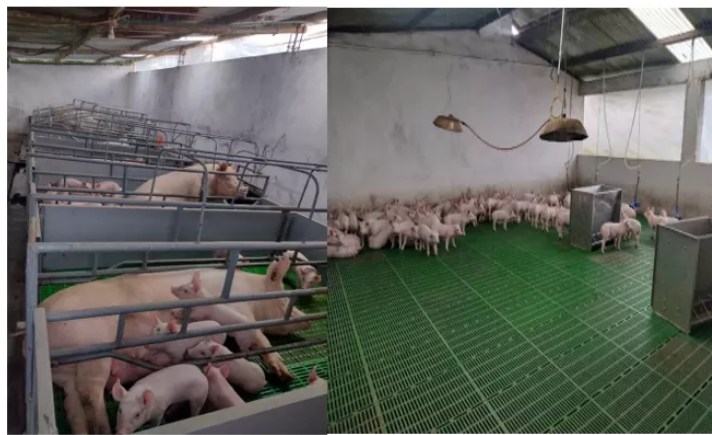
Figura 1. Visita Finca El Refugio

El sistema de reproducción implementado en la finca es por inseminación artificial, se cuenta con un laboratorio donde se realiza todo el proceso de la preparación de las pajillas y realizar el servicio de las cerdas que se encuentran en celo. La edad del primer servicio en las hembras es de 7 meses o que estén entre un peso de 140 Kg, se cuenta con un porcentaje de fertilidad de 96 % y de natalidad 12.5%, un intervalo entre partos de 4 días, el peso de la cría al nacer es de 1.4 Kg. El objetivo de la producción es cumplir con un servicio por concepción de 2.7 al año, y tener a la venta cerdos hasta la etapa de levante con un peso promedio de 25 kg y comercializarlos a diferentes fincas que se dedican solo a la ceba de cerdos para llevarlos a sacrificio.