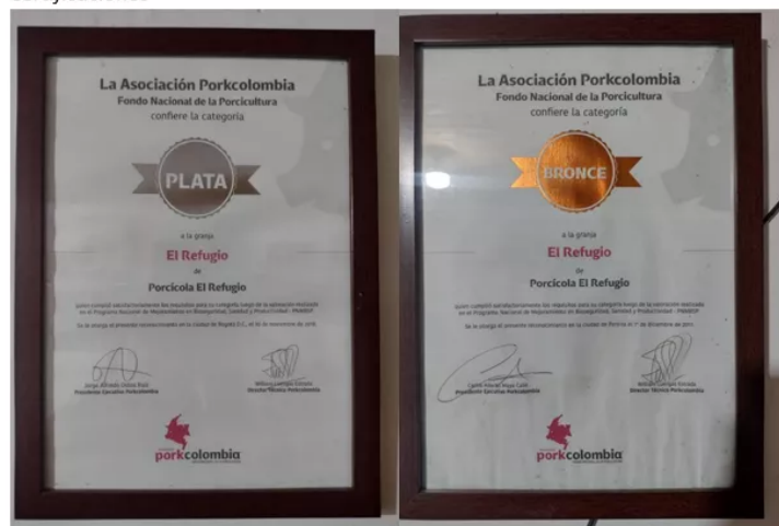
Figura 2. Certificaciones

Actualmente la finca El Refugio se encuentra certificada por el Instituto Colombiano Agropecuario (ICA), certificación otorgada por cumplir con todos los parámetros exigidos por la entidad, también cuentan con una segunda certificación otorgada por la Federación Nacional de Porcicultores (Porkcolombia), esto gracias al buen manejo de la producción garantizando un producto final inocuo y de calidad, la federación les otorgó medalla de plata.