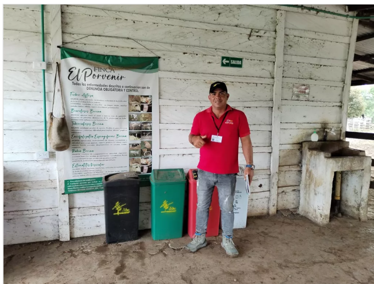
Figura 6. Área de Aseo

En la finca se viene manejando las buenas prácticas ganaderas acorde a lo establecido por la normativa que se maneja en el instituto colombiano agropecuario. esta finca está comprometida con el medio ambiente, no afecta el POT, del municipio. el manejo del personal es dirigido y en buena forma; cada trabajador esta direccionado a lo que debe hacer en su día laboral.