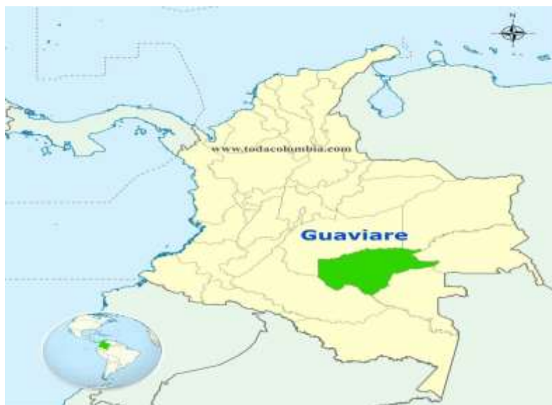
Ubicación Geográfica del Departamento del Guaviare