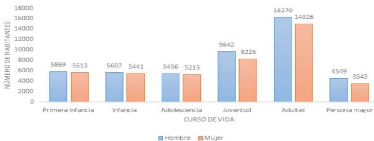
Población por Sexo y Grupo de Edad del Departamento del Guaviare, 2022