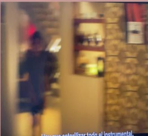
Hay que esterilizar todo el instrumental.

La familia vive por uno de los procesos más difíciles, la inigualable marta, que inundaba la casa con alegría al cantar, padece de un cáncer que parece ser mortal.