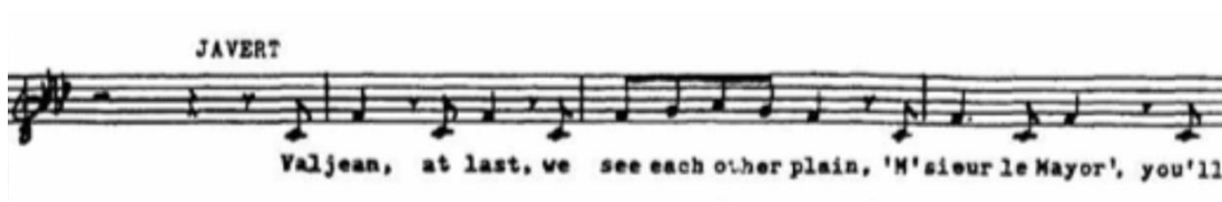
Figura 1.7 : The confrontation “Los miserables”

Nota: Figura extraída de la partitura de “ los miserables” [Schönberg, 1980]