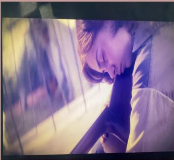
Trueba, F (2021) El olvido que seremos . Caracol television .