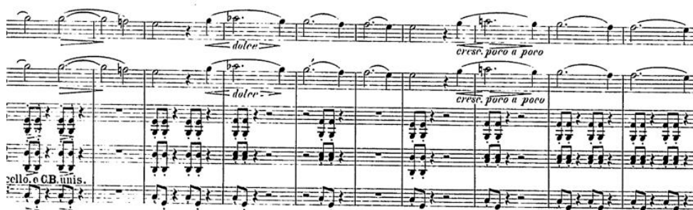
Figura 1.2: idee fixe “sinfonía fantástica”

Nota: Figura extraída de la partitura de la sinfonía fantástica.[Berlioz, 1830)]