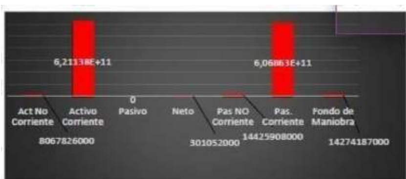
Tabla 13 Balance Fondo de maniobra 2019